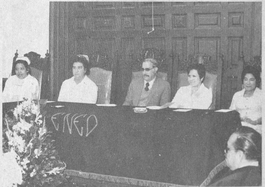
Presidium de la reunión en que se inauguraron los trabajos de Universidad Abierta, en Enfermería y Obstetricia