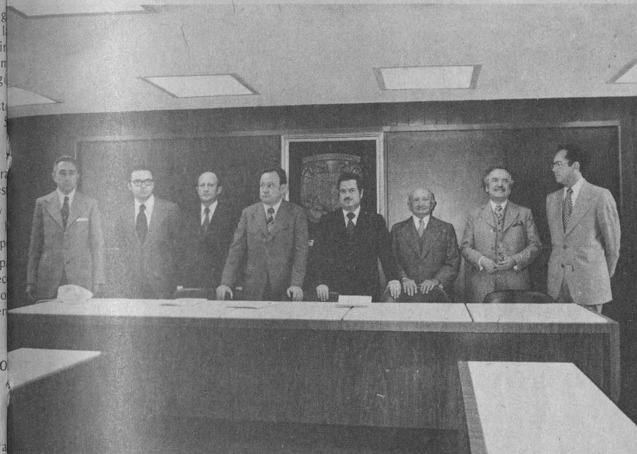
Integrantes del presidium en la inauguración de las nuevas instalaciones.

locan a la UNAM en una situación privilegiada para estudiar problemas fundamentales con un enfoque interdisciplinario a fin de proponer alternativas de solución. Asimismo dijo que la Universidad posee los