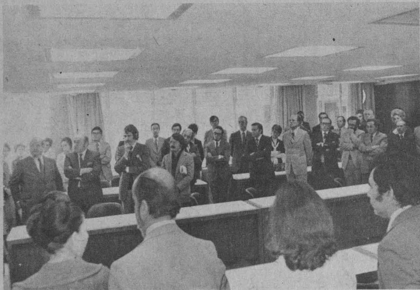
Parte de la asistencia al acto de inauguración.