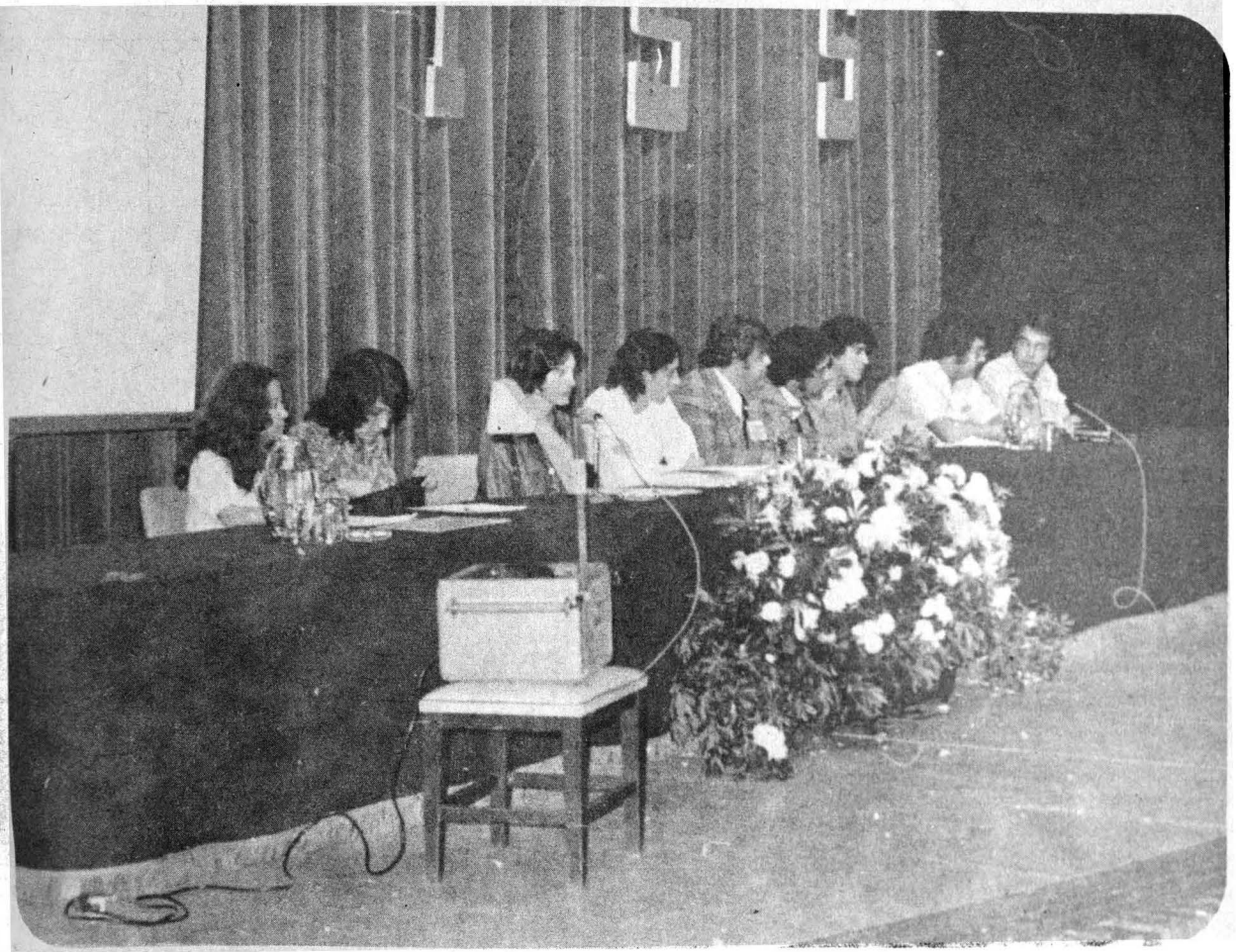
Presidium de una de las sesiones del II Congreso Nacional de Médicos Internos y en Servicio Social

“Se hace evidente la importancia de una planeación educativa que, conciente de los problemas y necesidades del país, participe en la evolución del proceso sustitución de tecnología extranjera y la urgencia de incorporar al estudiante, pasante o profesional a los programas de desarrollo integral para aquellas zonas marginadas que aún se encuentran en la fase de economía primaria y con marcada resistencia al cambio”.