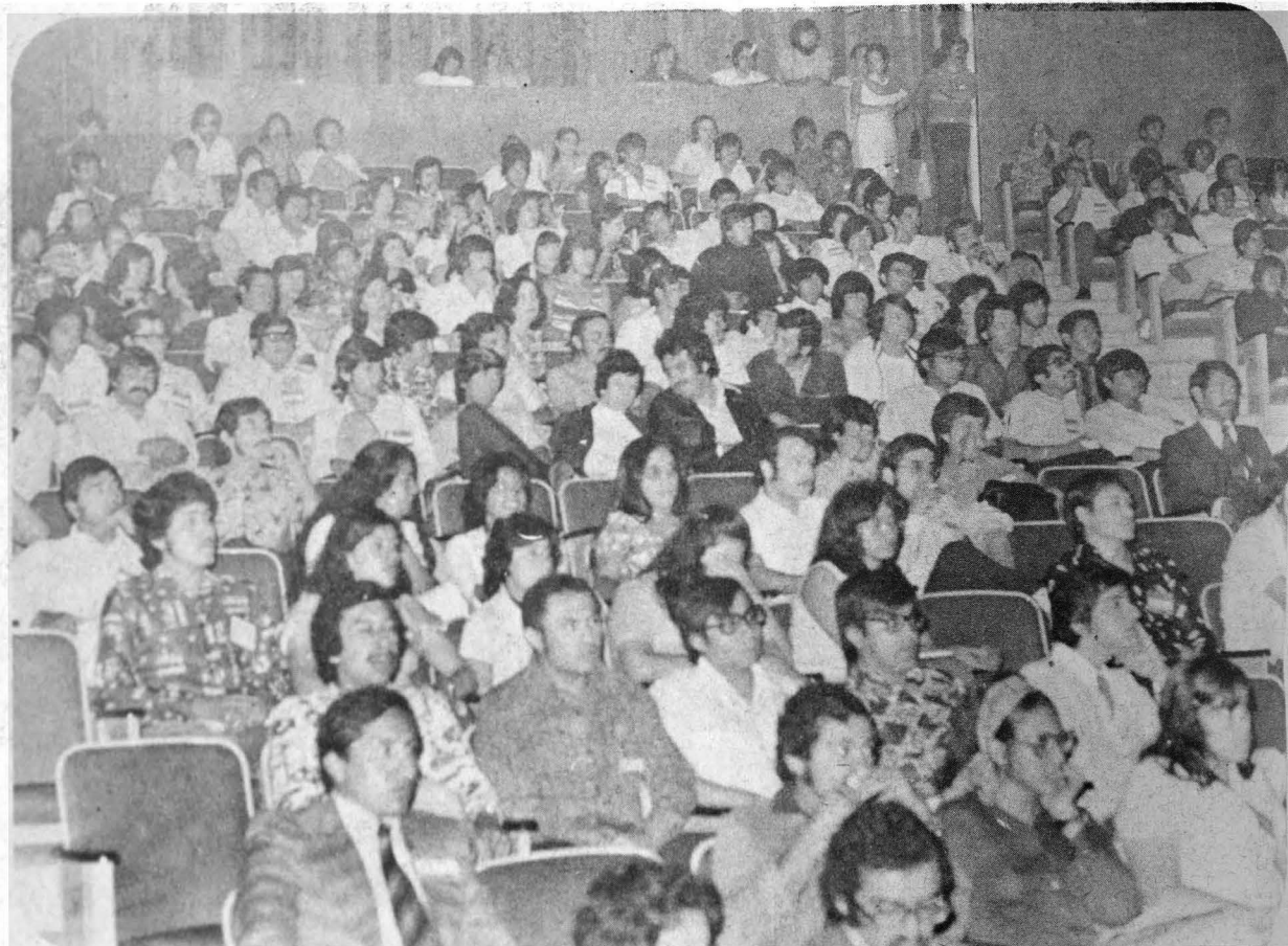
Aspecto parcial de los congresistas reunidos en Oaxtepec, Morelos, del 4 al 8 de agosto.