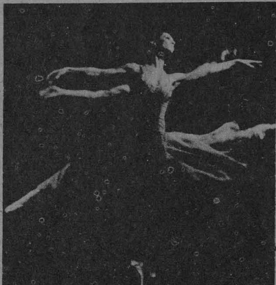
El próximo día 11 de diciembre, principia la Primera Temporada conjunta del Taller Coreográfico y la Orquesta de la Universidad .

En la función de apertura se interpretarán La muerte de un cazador , tercer movimiento de la Sinfonía No. 1 , de Mahler; Integrales , de Varese; Vitalitas , variaciones para piano, de Dickinson, y Huapango de Pablo Moncayo.