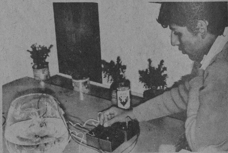
Nuevos métodos de enseñanza en el CCH.

Paralelamente a esta exposición se dará un ciclo de conferencias que serán dictadas por científicos universitarios especialistas en Química, Matemáticas, Astronomía y Física, y se proyectarán películas científicas proporcionadas por varias embajadas acreditadas en nuestro país.