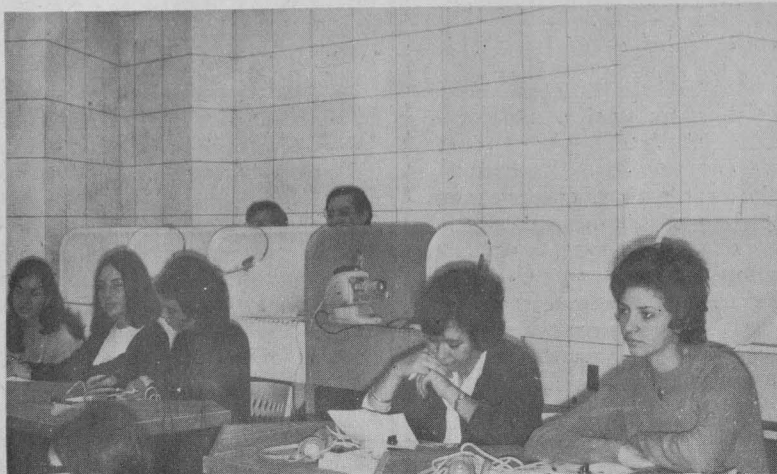
Salón de medios audiovisuales del CELE de la UNAM.