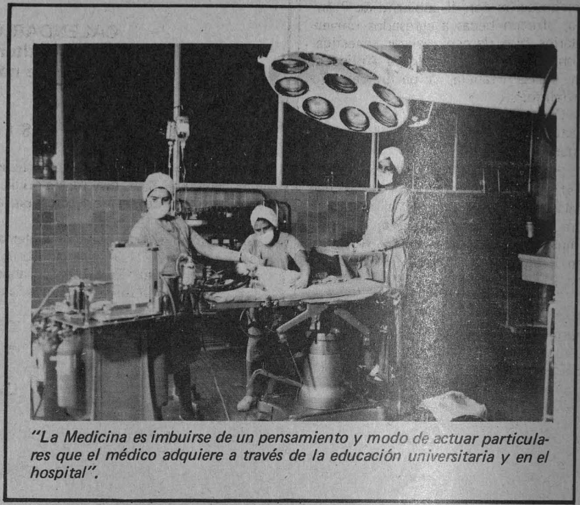
"La Medicina es imbuirse de un pensamiento y modo de actuar particulares que el médico adquiere a través de la educación universitaria y en el hospital".

En el referido artículo se hace especial hincapié en que la educación