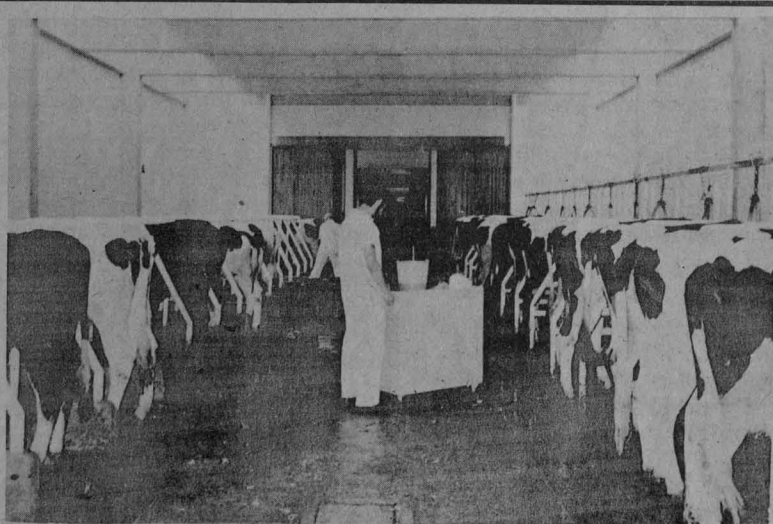
Diversos estudios sobre la planta tóxica Ruda se realizan actualmente en la Facultad de Medicina Veterinaria y Zootecnia de la UNAM.

Finalmente, dijo que estos estudios sobre la Ruda , actualmente sirven de modelo de investigación para trabajos de tesis que algunos pasantes de la Facultad de Medicina Veterinaria realizan.