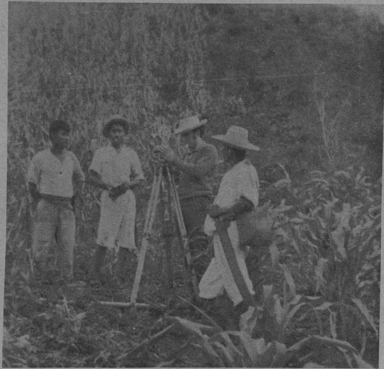
Ayudar a los campesinos, principal motivación de los pasantes de Ingeniería.