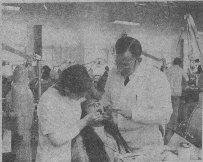
Un catedrático de la Escuela de Odontología dirigiendo la práctica a una de sus alumnas.

V. Los precios de los trabajos son exclusivamente el de los materiales empleados y el Derecho de Clínica. Los pagos se efectúan en la Administración, donde se entrega el recibo correspondiente.