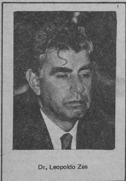
Dr. Leopoldo Zea

de teatro con participación de grupos teatrales de todo el país, y, simultáneamente, la organización de un curso vacacional de teatro para estudiantes de provincia. La reunión propone también que se haga un estudio para el financiamiento de las giras de teatro y otras similares, para que los gastos por este concepto emitidos por cada institución sean menores y los resultados del intercambio más amplios y positivos.