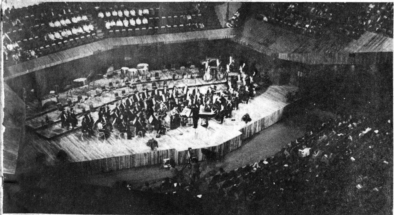
Aspecto de la sala Nezahualcóyotl durante el concierto inaugural.

Con las mejores condiciones acústicas, la puso en servicio el Rector Soberón; Magistral concierto inaugural de la OFUNAM