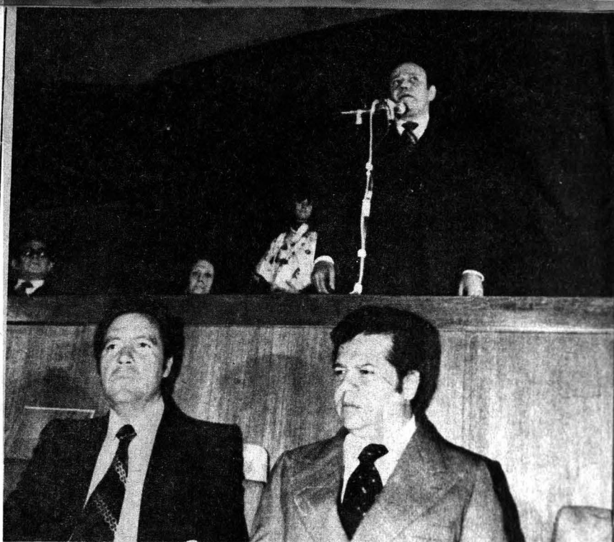
El Rector Soberón en el momento de declarar inaugurada la sala de conciertos el jueves anterior.

el que se multiplicaron elogiosos comentarios para el recinto y para la Orquesta, el público ocupó nuevamente sus butacas con cabecera en forma de concha para optimizar aún más la acústica, y se dispuso a escuchar la segunda parte del concierto, que estuvo compuesta