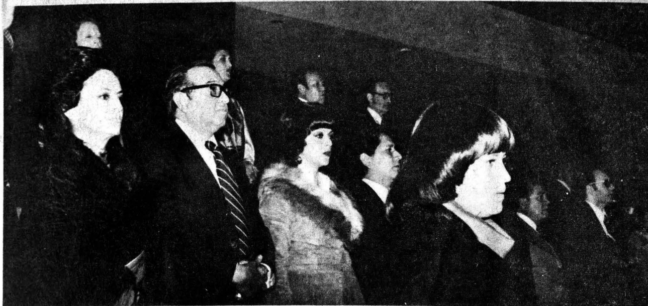
Momento en que se entonó el himno nacional al iniciarse el concierto de inauguración.

bajo la dirección del maestro Gabriel Saldívar. Ahora voces e instrumentos imprimían mayor majestuosidad a la Sala de Conciertos y hacían crecer la emoción y los aplausos de los asistentes.