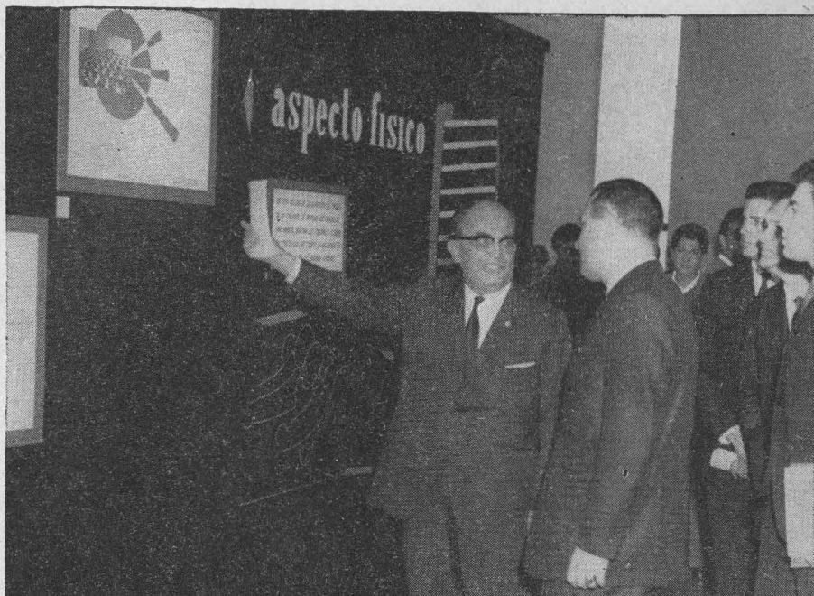
El doctor Ignacio Chávez, Rector de la Universidad Nacional Autónoma de México, el licenciado Diego G. López Rosado y otros funcionarios universitarios recorren la exposición "La Universidad Nacional en cifras 1964", instalada en el Museo de Ciencias y Arte, en C. U.

Al tomar la palabra el licenciado Diego G. López Rosado se refirió a los avances logrados por nuestra máxima Casa de Estudios durante el período 1961-1964. Dijo que la Universidad cuenta en la actualidad con el mayor número de aulas, laboratorios, talleres, bibliotecas, etcétera, que nunca haya tenido; con un mayor presupuesto que le ha permitido tener más maestros, investigadores, empleados, becas de ayuda para la formación de profesores de carrera, etcétera; lo que se ha traducido en un constante aumento de días de labores y también en una mayor asistencia de profesores y alumnos.