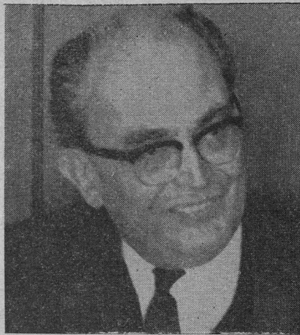
Doctor Ignacio Chávez

Con orgullo informo a la Comunidad Universitaria que la reacción del C. Presidente de la República fue rápida, inmediata, actitud de apoyo sin restricciones. A partir de ese día la Universidad pudo contar con los fondos necesarios para lanzar su programa de formación de nuevos catedráticos de carrera. Ofrecimos el año pasado 500 becas para otros tantos candidatos seleccionados, que siguieran los cursos intensivos en México o, cuando la naturaleza del tema lo exigiera así, en el extranjero, y que se comprometieran, al terminar su preparación —que va de uno a tres años, según la disciplina y según la formación ya tenida— que se comprometieran, digo, a consagrarse