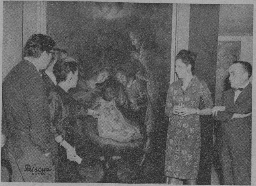
Fotografía tomada en la sesión de apertura de la exposición que se exhibe en la Galería Aristos.

"Natividad" es el título de la exposición que se presenta en la Galería Aristos (Insurgentes Sur 421), en la que se exhiben 35 cuadros y varias esculturas de los siglos XVII y XVIII.