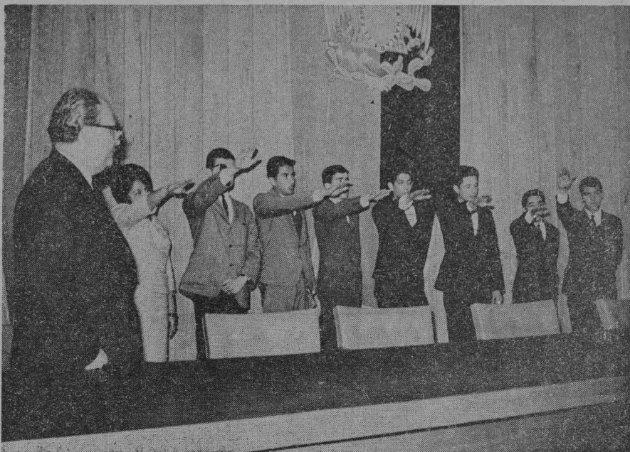
El doctor Ignacio Chávez, Rector de la UNAM, toma la protesta de rigor al nuevo Comité Ejecutivo de la FUSA.

El señor Rector, al hacer uso de la palabra, exhortó a todos los estu-