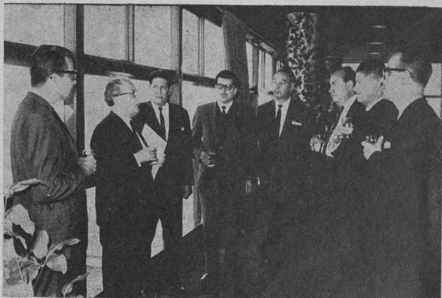
El doctor Ignacio Chávez, Rector de la UNAM, departe amigablemente con un grupo de directores y decanos de Facultades de Medicina de Latinoamérica.