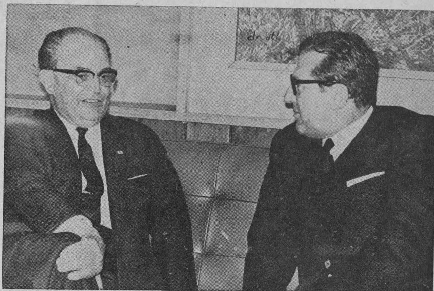
El doctor Mario Zagari, subsecretario de Relaciones de Italia durante su visita al doctor Ignacio Chávez, Rector de la UNAM a nuestra máxima Casa de Estudios.

El subsecretario y sus acompañantes felicitaron al Rector por las medidas adoptadas para solucionar el problema de la sobrepoblación estudiantil.