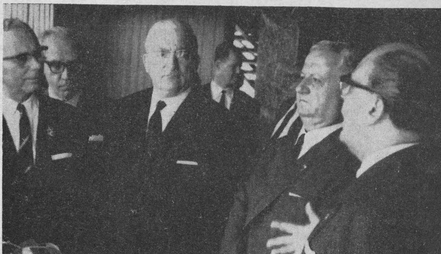
Los parlamentarios franceses que visitaron Ciudad Universitaria recibieron explicaciones del doctor Ignacio Chávez, Rector de la Universidad Nacional Autónoma de México, sobre el funcionamiento de nuestra máxima Casa de Estudios

que gracias a una adecuada orientación vocacional, los estudiantes se interesan cada vez más en las carreras técnicas, tanto, que es la Facultad de Ingeniería la que actualmente ocupa el primer lugar en la demanda estudiantil, siguiéndole la Facultad de Medicina, Comercio y Administración de Empresas y Química.