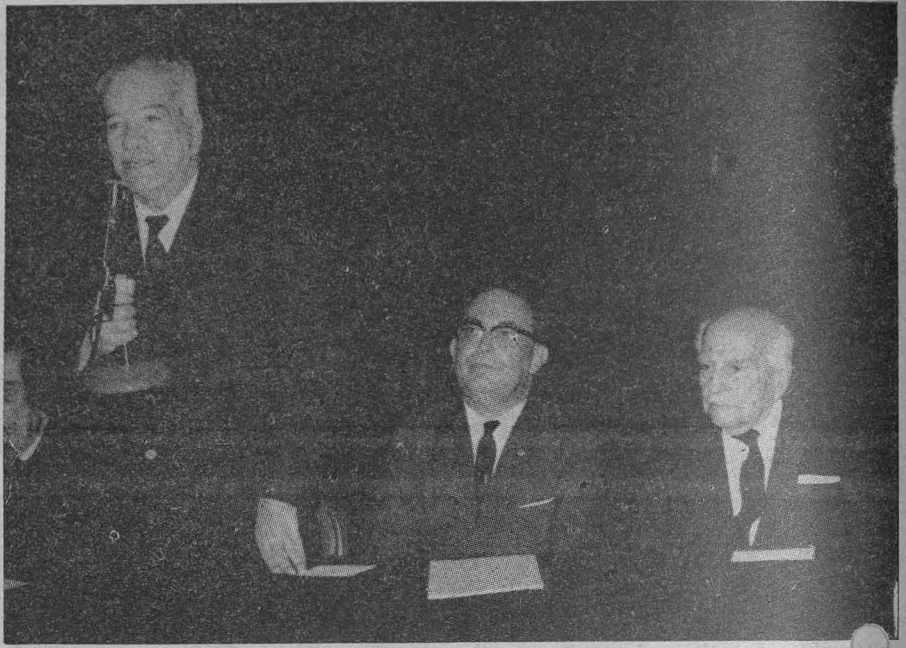
Brillante trayectoria de la Facultad de Medicina. Los miembros de la generación 1909-1914 se muestran orgullosos de ello en la conmemoración de sus bodas de oro.