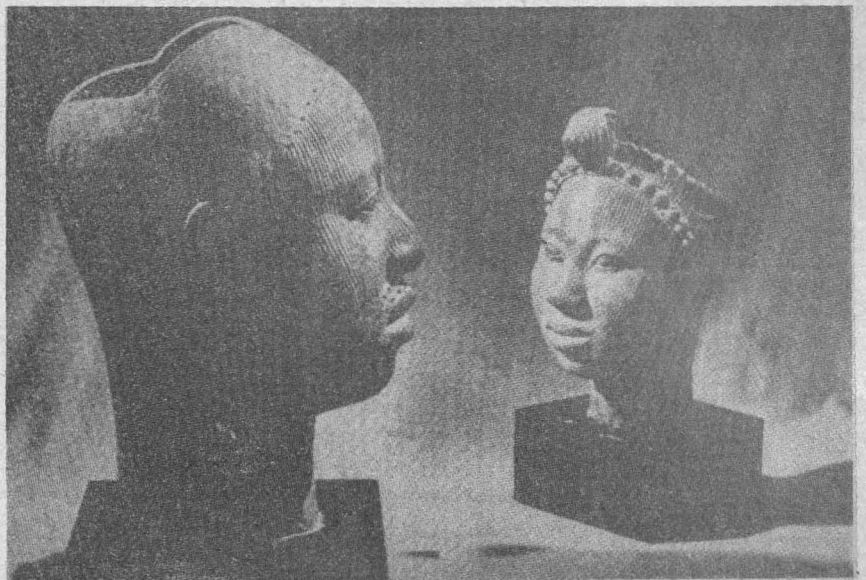
...no hay raza que, guiada por la razón, no llegue a alcanzar la virtud...

Para justificar la aspiración de los grie-