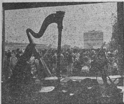
La orquesta espera