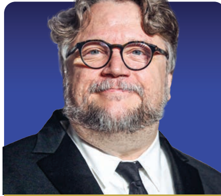
GUILLERMO DEL TORO

Es matemática y física. Una de sus principales aportaciones es la teoría de las ondículas, esencial en la detección de las ondas gravitacionales y para el cine digital, así como para la rapidez en el diagnóstico mediante el uso de imágenes. Fue la primera mujer profesora titular de matemáticas en la Universidad de Princeton en ganar el Premio Frederic Esser Nemmers de Matemáticas. Las ondículas son una herramienta matemática que permite, entre otras cosas, comprimir datos y recuperarlos, sin pérdida de información.