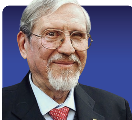
LOURIVAL DOMINGOS POSSANI POSTAY

Es una de las escritoras más representativas de nuestra nación, especializada en la literatura hispanohebraica medieval, y del pensamiento y artes del siglo XX. Tiene un profundo conocimiento de la lengua castellana, comprensión y recuperación de la memoria histórica del exilio español en México, además de su brillante currículum en los estudios de la cultura sefardí. En la literatura mexicana inauguró la novela neohistórica que integra elementos autobiográficos y de ficción. Escribe poesía, cuento y ensayo.