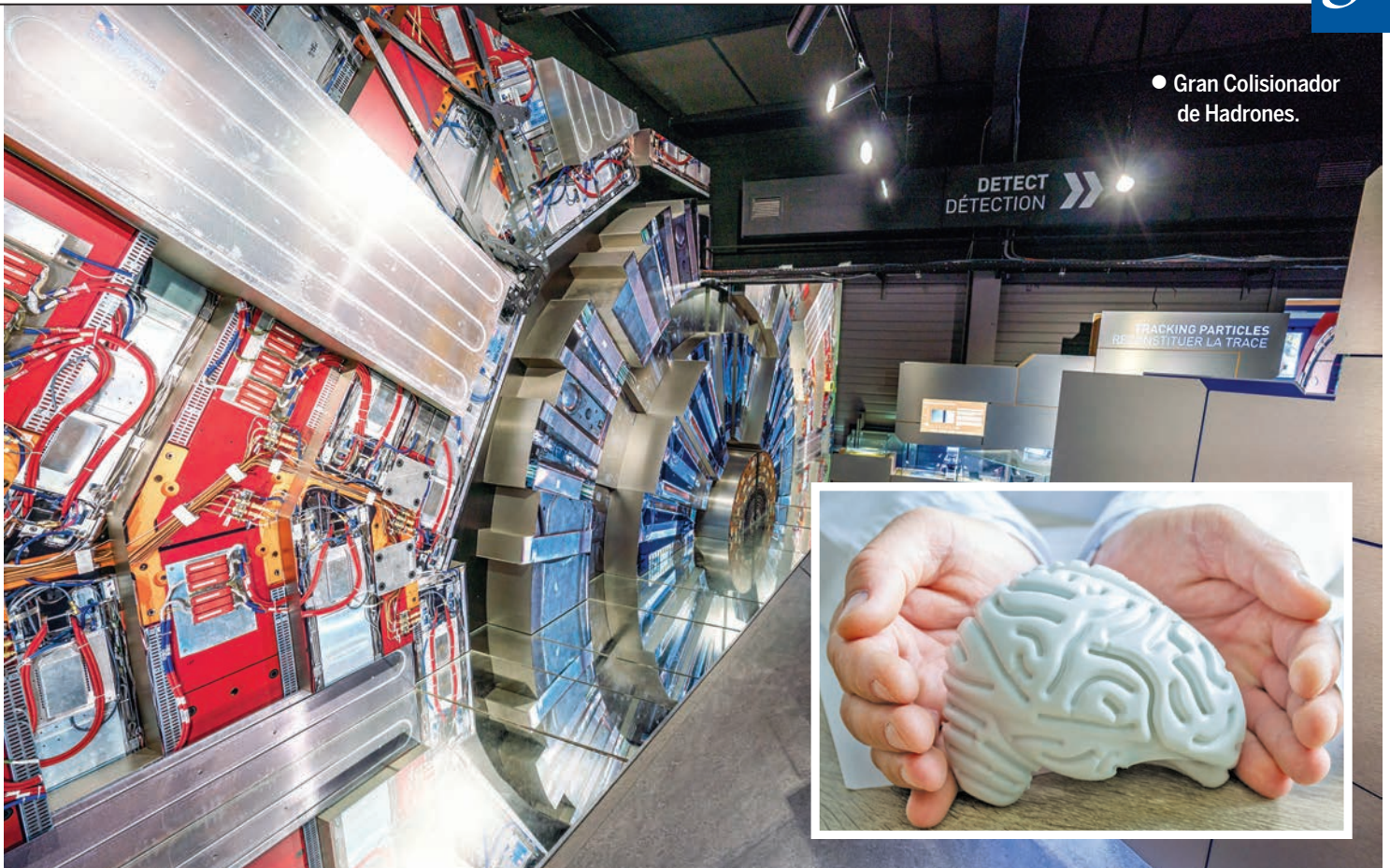
● Gran Colisionador de Hadrones.

En particular, la tecnología de semiconductores que impulsó el rápido crecimiento de la industria de la tecnología de la información en los últimos 50 años también desempeña un papel clave en el notable desarrollo de detectores para experimentos de física de alta energía (HEP).