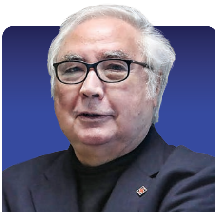
MANUEL CASTELLS OLIVÁN

Es una filósofa posestructuralista, profesora y activista estadounidense, considerada una de las pensadoras contemporáneas más influyentes en el área de los estudios de género, la filosofía política, la ética, el género, la sexualidad y el feminismo. Es una de las fundadoras de la llamada teoría queer; sus escritos inspiran la teoría sobre la homosexualidad, además de haber construido un pensamiento no binario sobre el género que otorga una liberación al cuerpo. Ha profundizado en conceptos como la desposesión, la violencia e igualdad social.