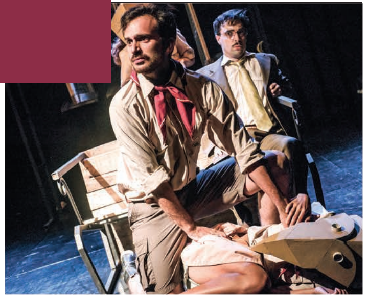
● Captura de aves silvestres , Universidad de Buenos Aires.