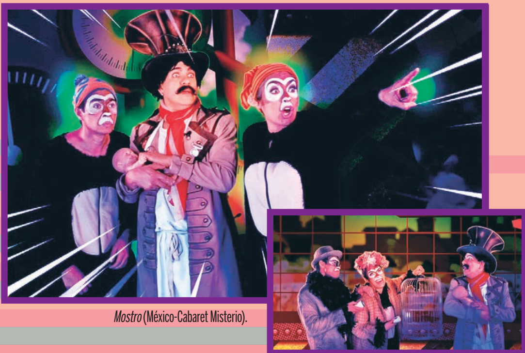
Mostro (México-Cabaret Misterio).