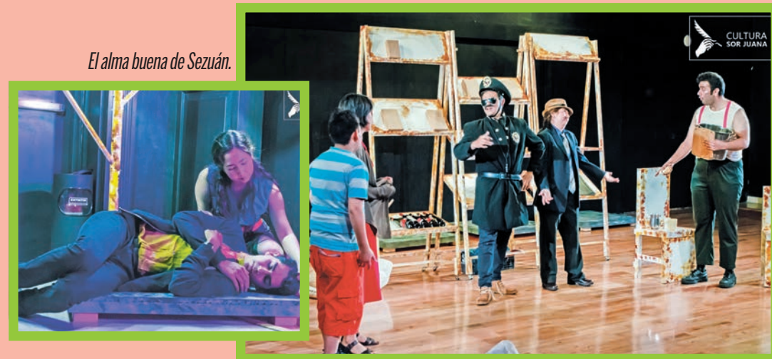
El alma buena de Sezuán.