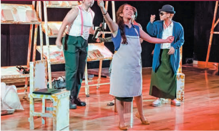
● El alma buena de Sezuán , Instituto Oviedo, León, Guanajuato.