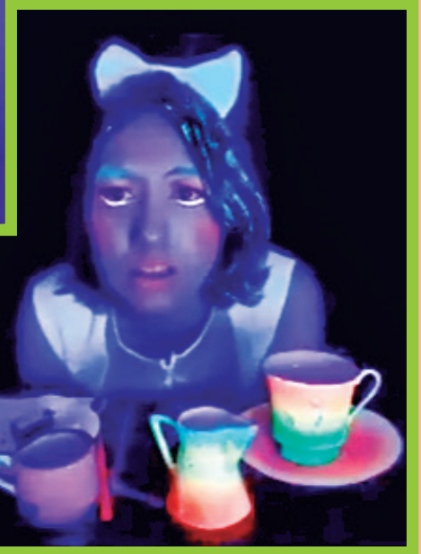
Alicia en el País de las maravillas.