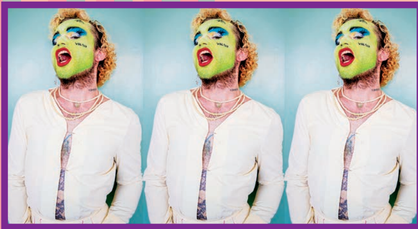
Glooptopia (Reino Unido).