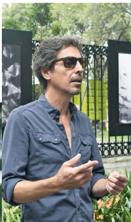
● El artista de la lente.