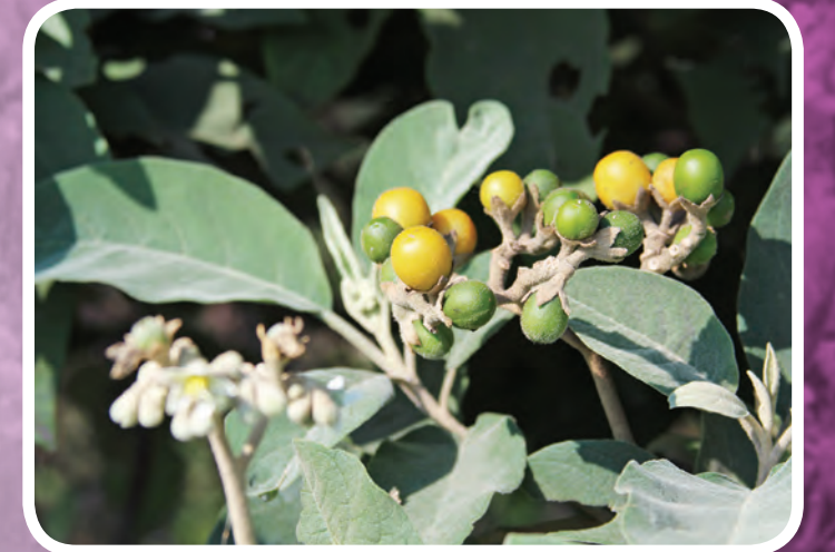
Fragmento de lava, reducto de vida