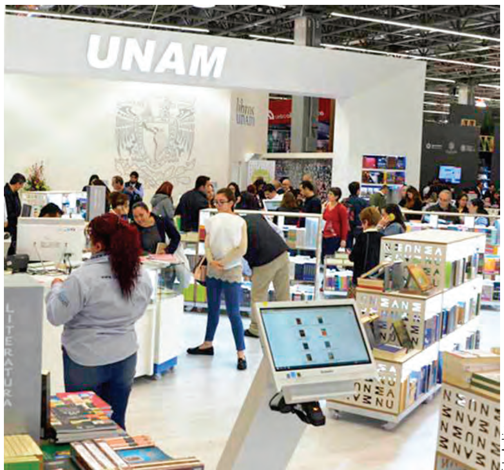
● Exhibición puma en 390 metros cuadrados.