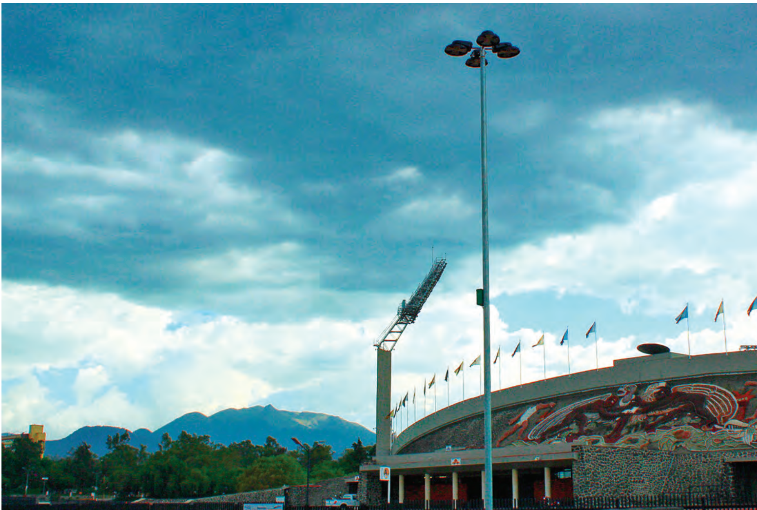
▲ Kali Anamim Solorio Osorio , alumna de la Prepa 2. Historia viviente.

Gaceta ilustrada es tuya Envía tus fotos de todos los territorios puma