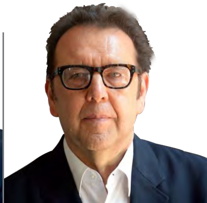
César Moheno Todos por México

Una conversación con los representantes de los diferentes partidos políticos, en la que se expondrán las propuestas en torno a la cultura