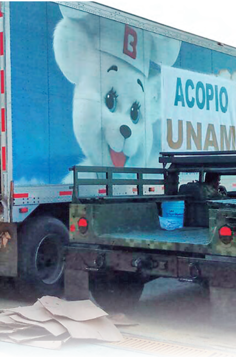
● Llega ayuda desde el Centro de Acopio de la UNAM a Ixtepec, Oaxaca.