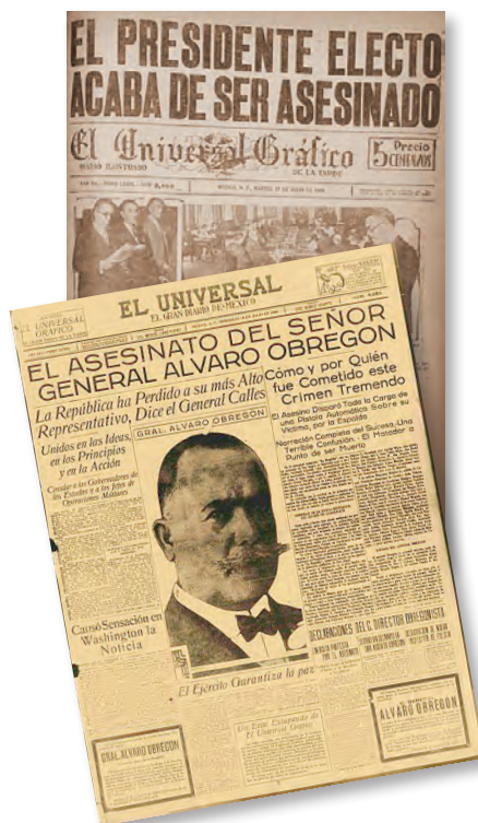
LA NOTICIA DEL ASESINATO DE OBREGÓN

A principios de octubre, Serrano preparó una asonada militar en la que serían eliminados Obregón, Calles y el general Joaquín Amaro. El intento fue descu-