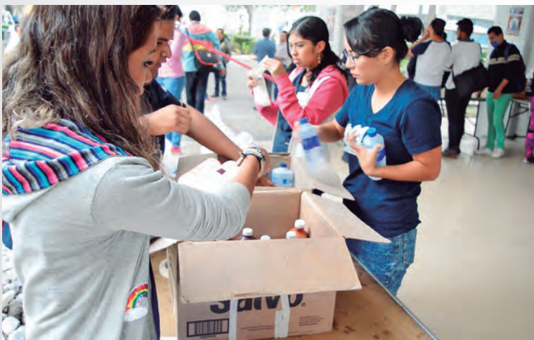
► FES Zaragoza