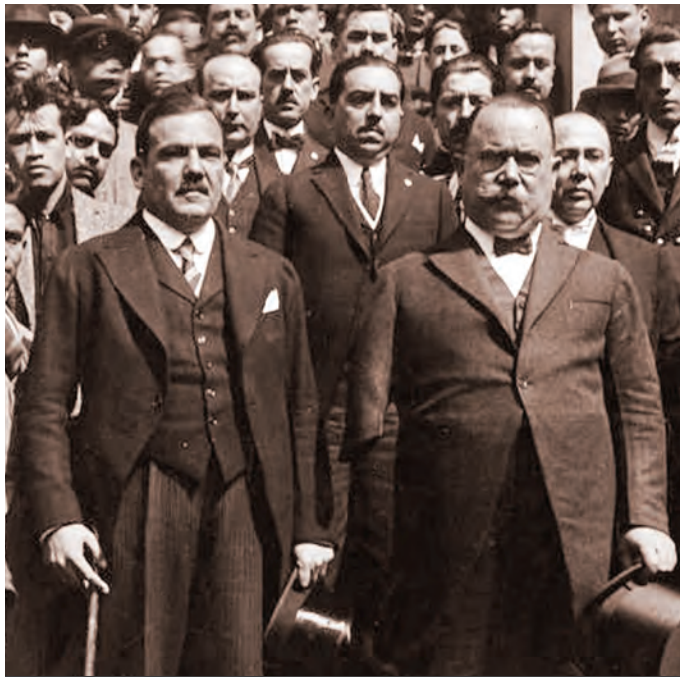
PLUTARCO ELÍAS CALLES Y ÁLVARO OBREGÓN