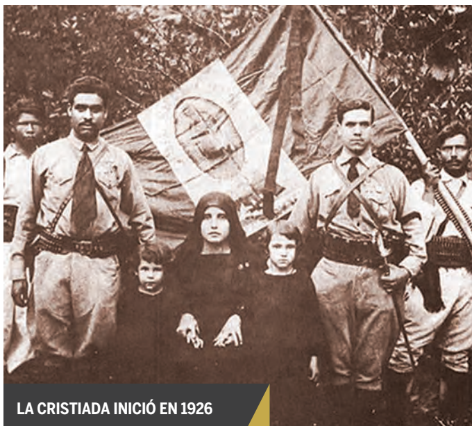
LA CRISTIADA INICIÓ EN 1926

y pagar cuota al gobierno. Calles hizo cumplir dichas medidas por medio de la fuerza, lo que agravó el conflicto, que abarcó de 1926 a 1929.