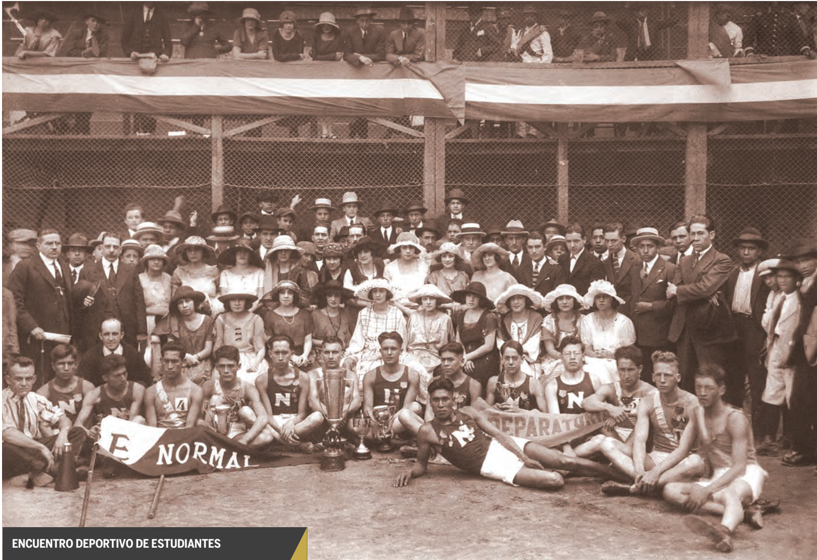
ENCUENTRO DEPORTIVO DE ESTUDIANTES

cultural, pues durante 10 años había sido rector de la Universidad Popular. Parecía el candidato ideal para el cargo, pues la Universidad legitimaría su existencia por medio de un acercamiento a las clases populares. La marcada labor de extensión universitaria demostraría la utilidad de los conocimientos universitarios.