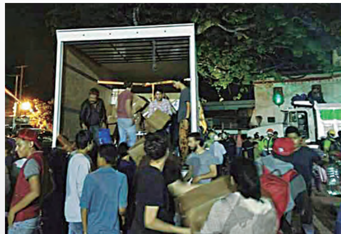
► FES Cuautitlán