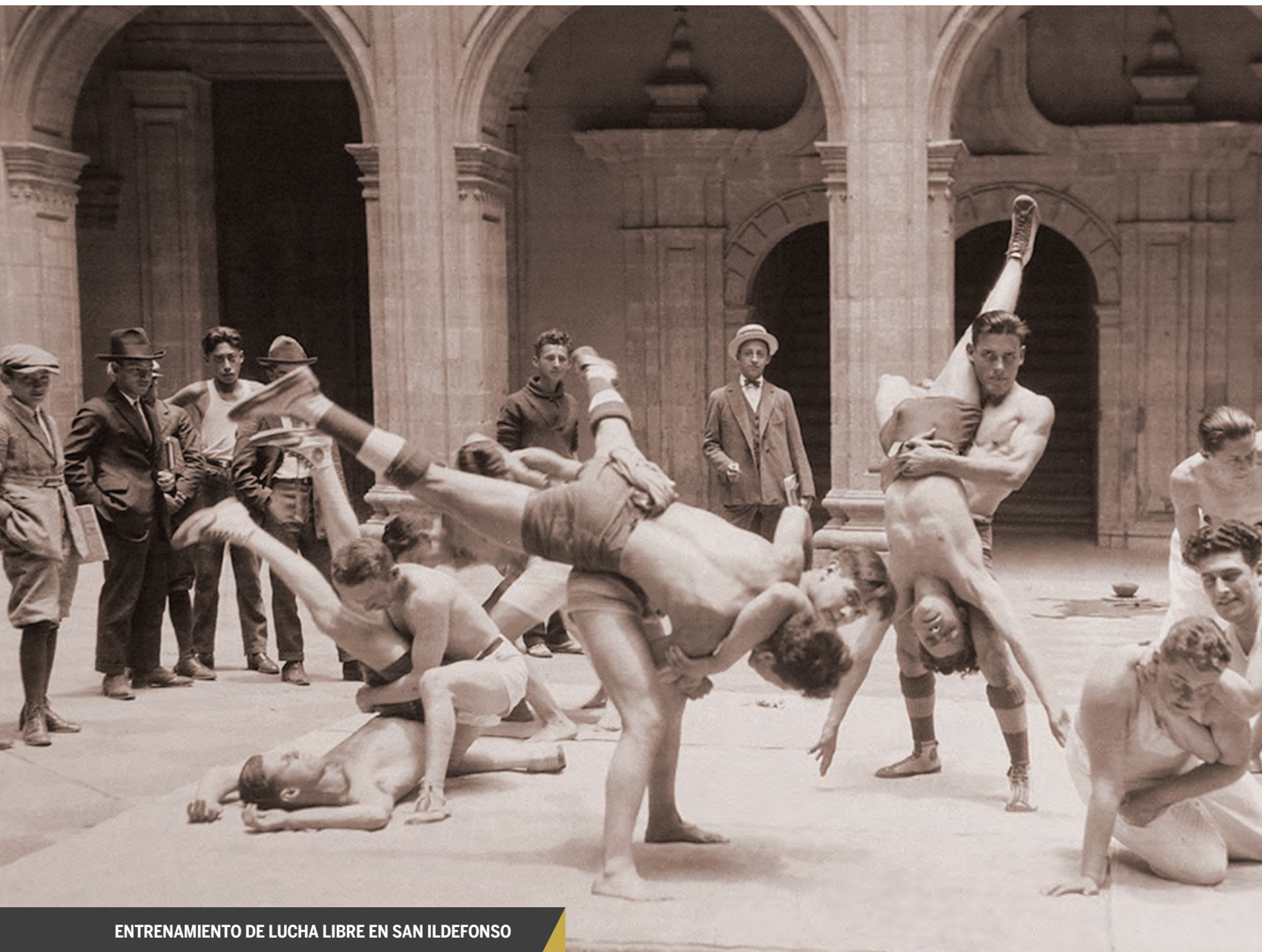
ENTRENAMIENTO DE LUCHA LIBRE EN SAN ILDEFONSO

giró en torno a la educación popular, para lo cual impulsó a la escuela rural dejándola en manos de Moisés Sáenz. Ésta fue prioridad en el gobierno callista, nada impidió su desarrollo a pesar de los recursos limitados del erario, mientras que la universidad pasaba a un plano de indiferencia.