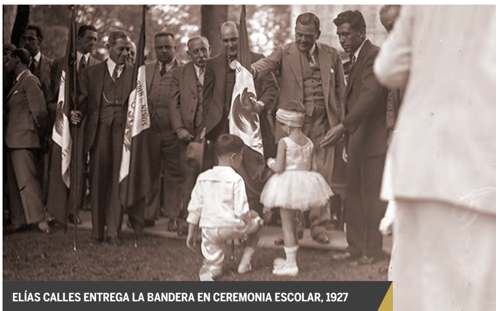
ELÍAS CALLES ENTREGA LA BANDERA EN CEREMONIA ESCOLAR, 1927