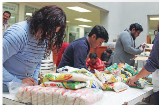
► FES Aragón