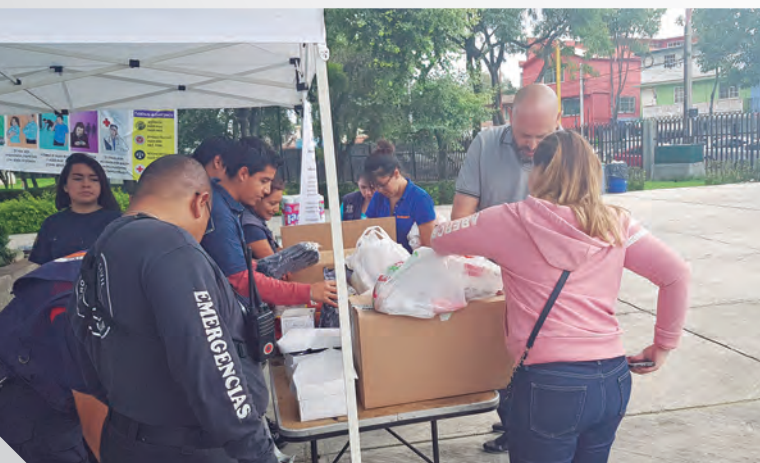
► FES Iztacala