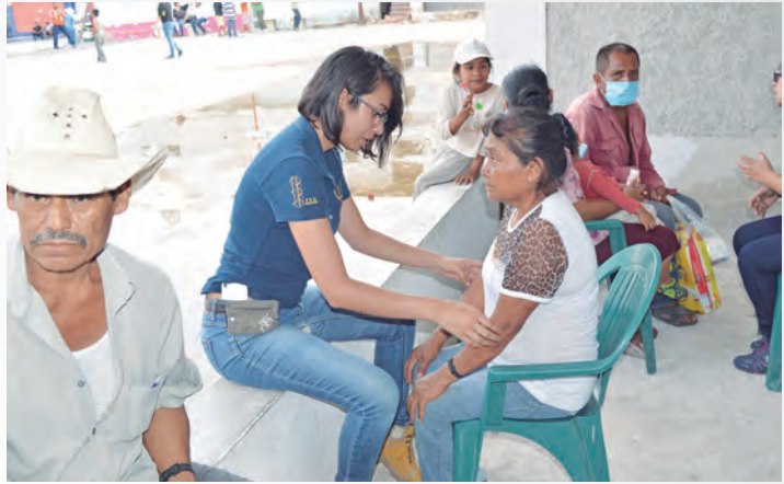
● Brigada FES Zaragoza en Santa Mónica, Coetzala , Puebla.