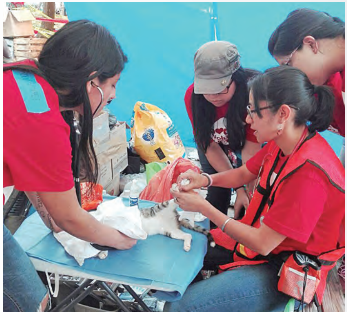
● Brigada de médicos veterinarios de FES Cuautitlán.