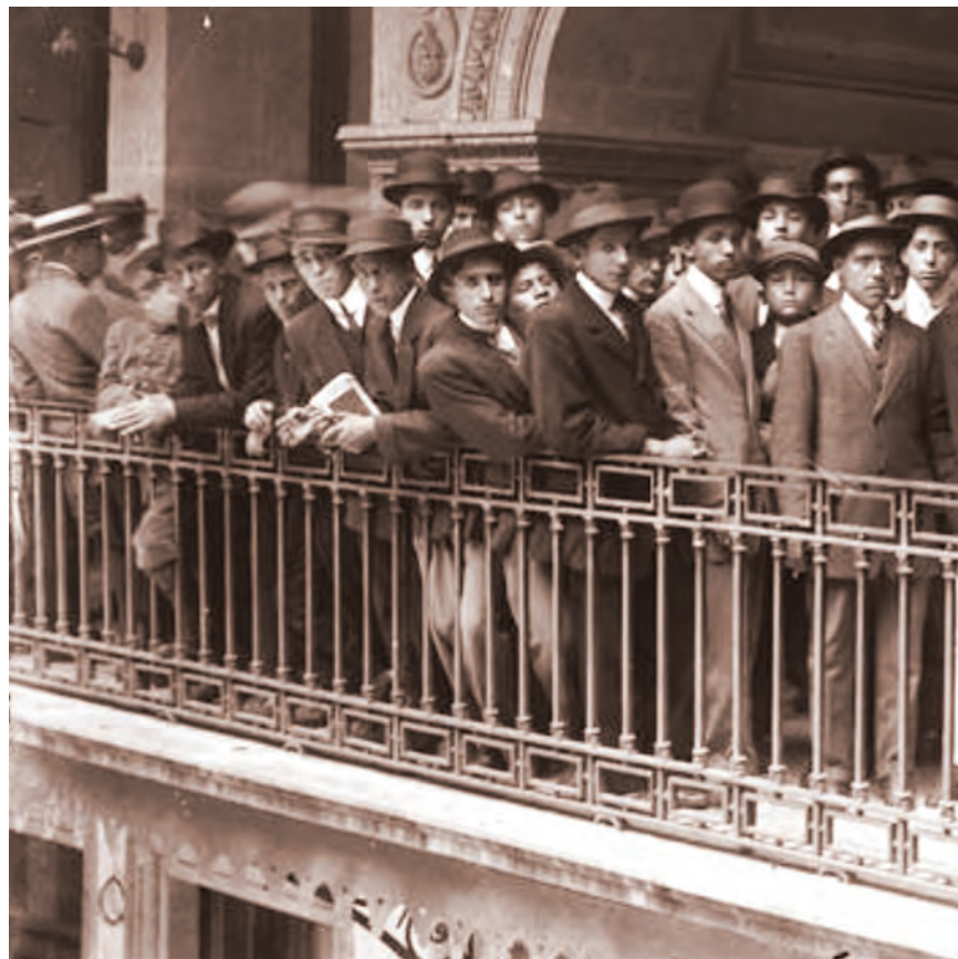
ALUMNOS DE LA ENP EN 1925

La redacción del decreto impone los propósitos del Estado: ampliar la educación primaria, resolver el problema de congestión de la Escuela Preparatoria en dos ciclos: uno de tres y otro de dos años; democratizar la segunda enseñanza y dividir la enseñanza preparatoria.