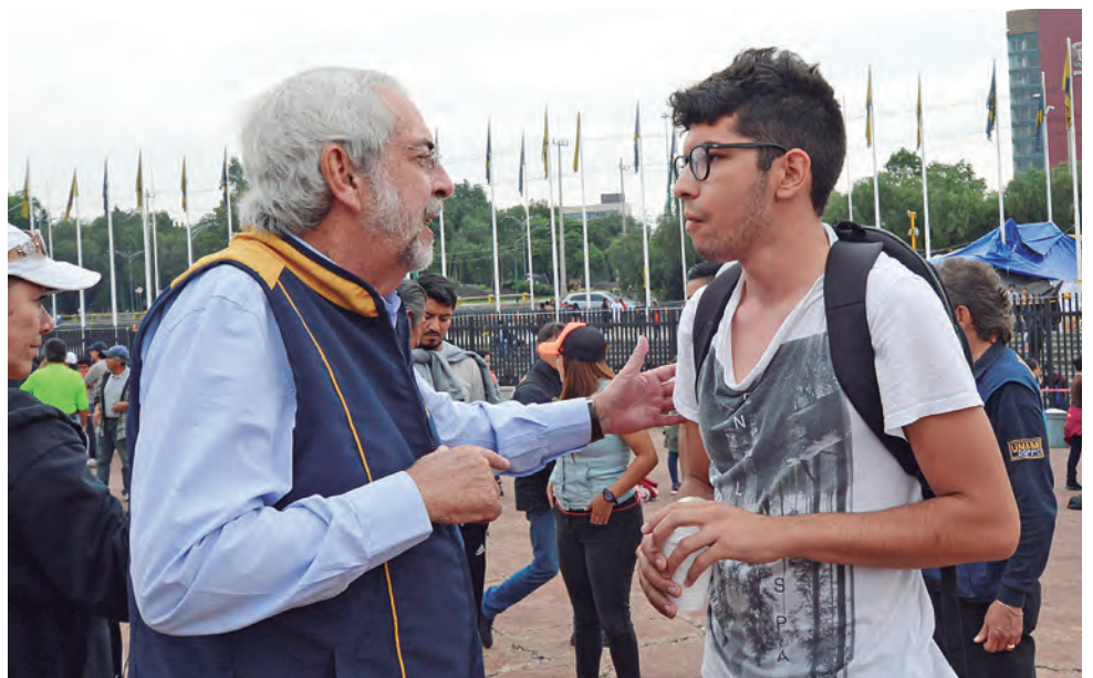
● El rector Enrique Graue en el centro de acopio del Estadio Olímpico.

Alumnos y egresados de la Escuela Nacional de Enfermería y Obstetricia (ENEO) acudieron a San Gregorio, Xochimilco. Se ha proporcionado atención de enfermería, empaquetamiento de materiales para primeros auxilios y curación para hospitales en servicio, así como espacios provisionales de revisión médica.