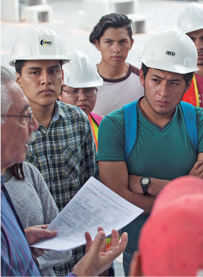
● Brigada de la Escuela Nacional de Trabajo Social.