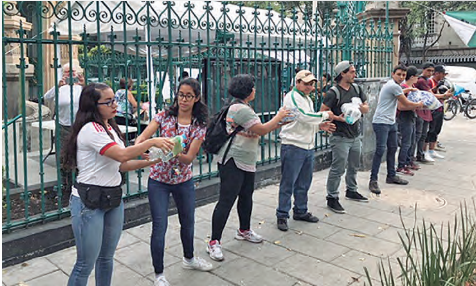
► Casa Universitaria del Libro