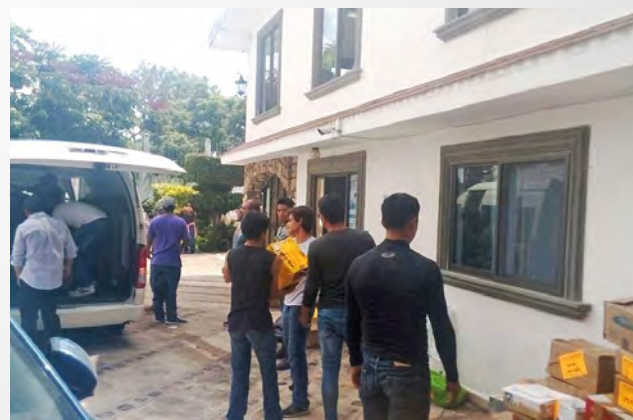
► UNAM Morelos.