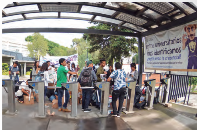
► FES Acatlán