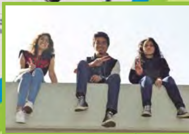
► En las alturas.