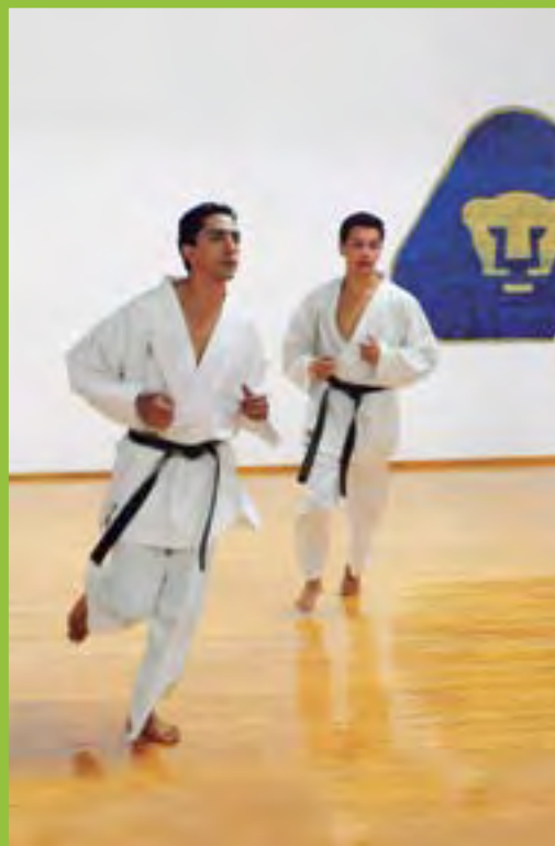
▶ Arte marcial.