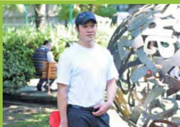
► Mundo de letras.