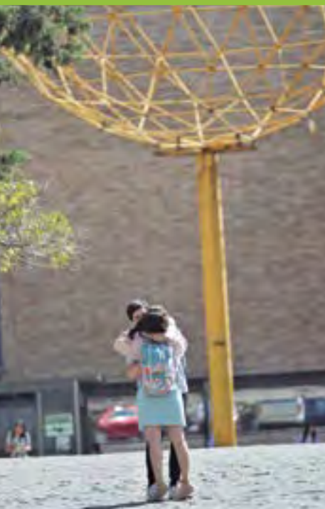
Encuentro de primavera.