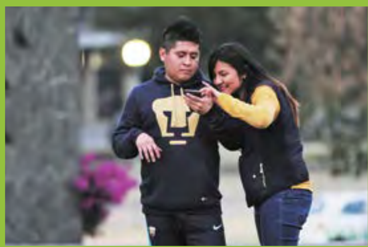
► En las redes sociales.