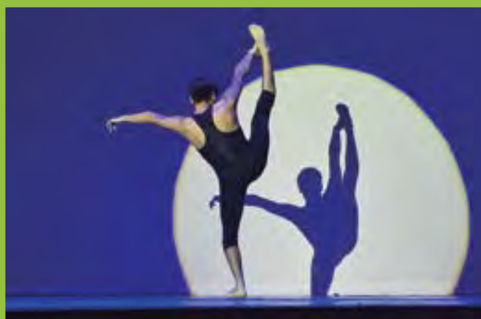
▶ Espejo de sombra.

Diseño: Oswaldo Pizano.