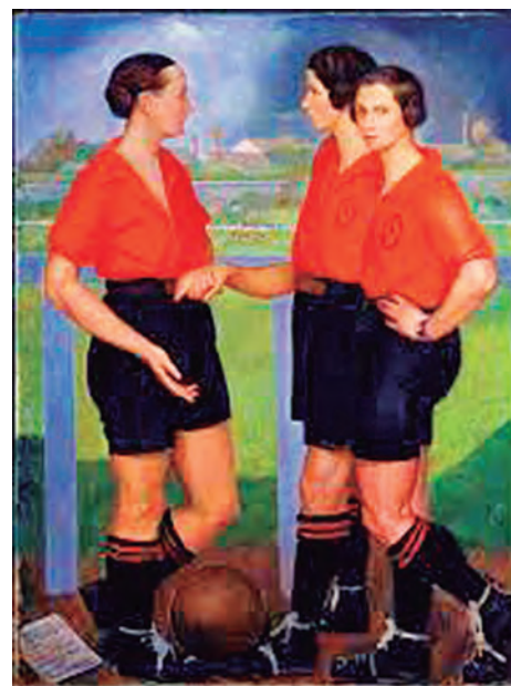
● Las futbolistas, Ángel Zárraga, 1922.

El Auditorio Doctor Samuel Ramírez Moreno, de la Dirección General de Atención a la Salud, fue la sede de este ciclo de conferencias organizado de manera conjunta por el Instituto de Investigaciones Filológicas y la Dirección General del Deporte Universitario. g