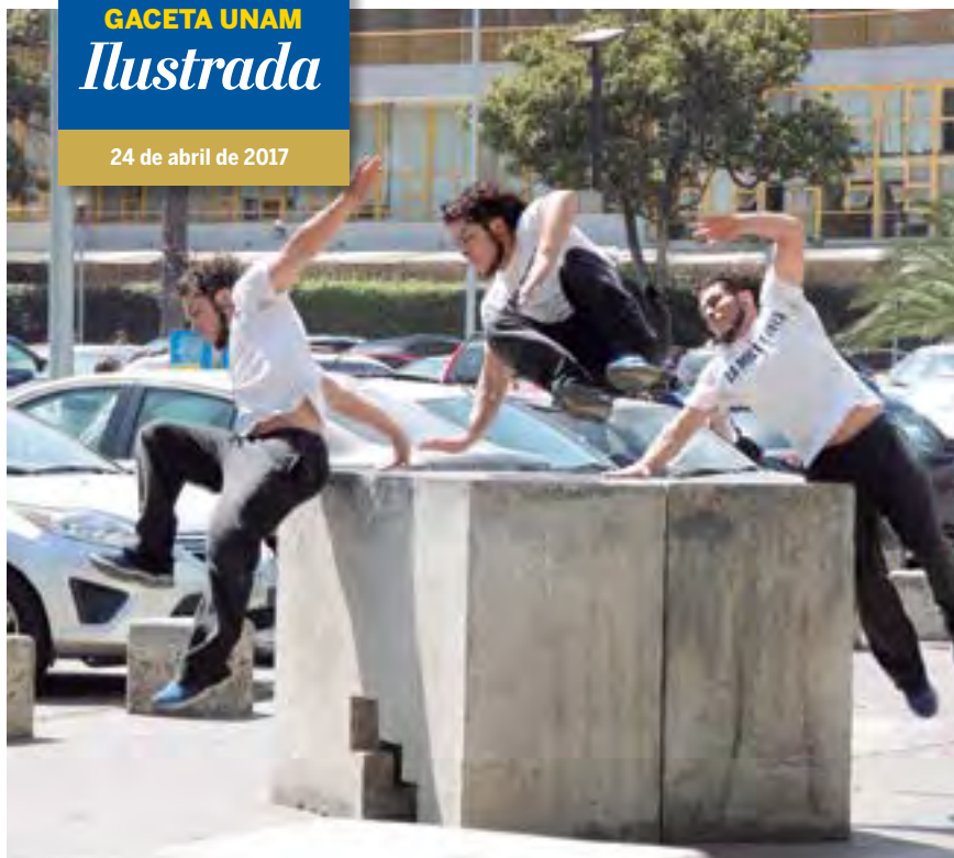
► Recorrido de un salto.