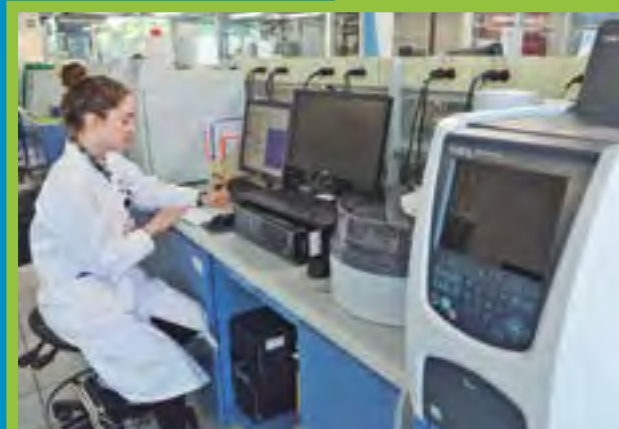
► Ciencia y tecnología.