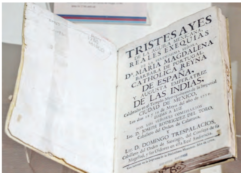
● Tristes ayes de la águila mexicana (1760).