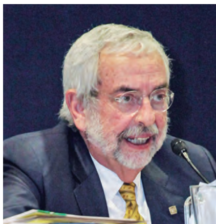
• El rector Enrique Graue.