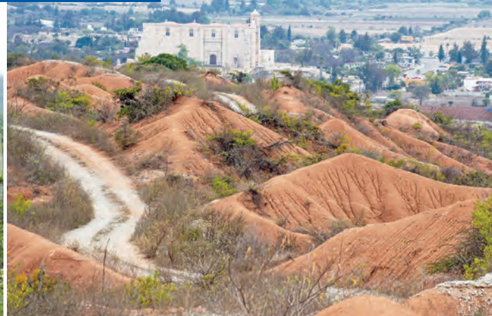
● Bellezas naturales de México.