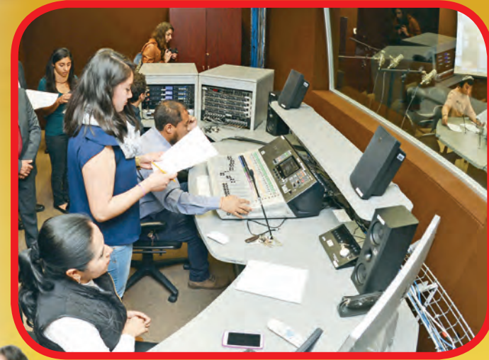
Centro de Estudios Municipales y Metropolitanos