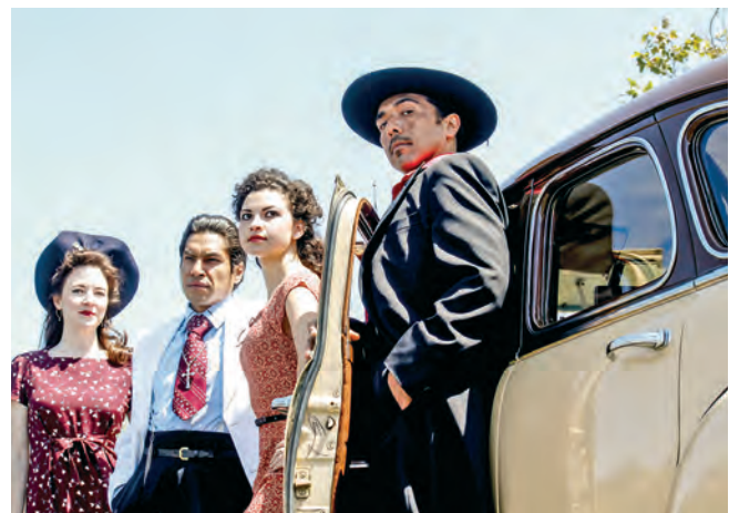
• Fiebre latina (1981, Luis Valdez).