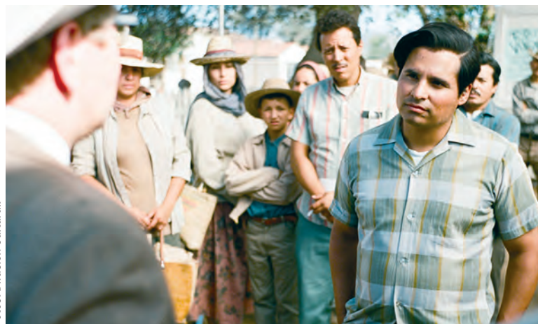
• César Chávez (2013, Diego Luna).