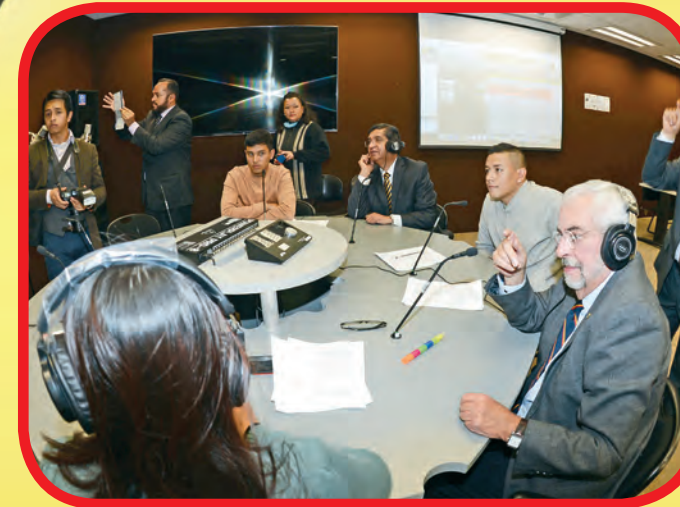
Talleres de comunicación y diseño