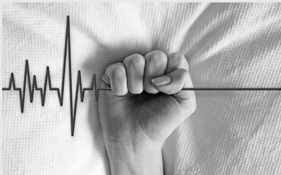
● Valores religiosos y concepciones éticas, a debate.

Lo que se pretende, explicó el también miembro del Colegio Nacional, es que los sistemas jurídicos la aprueben dentro de condiciones de seguridad plena,