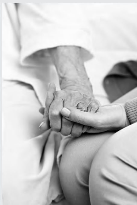
● Derechos de quienes desean preservar su dignidad.

con protocolos médicos y jurídicos muy rigurosos, en favor de quienes deseen ser privados de una vida que ya consideran innecesaria.