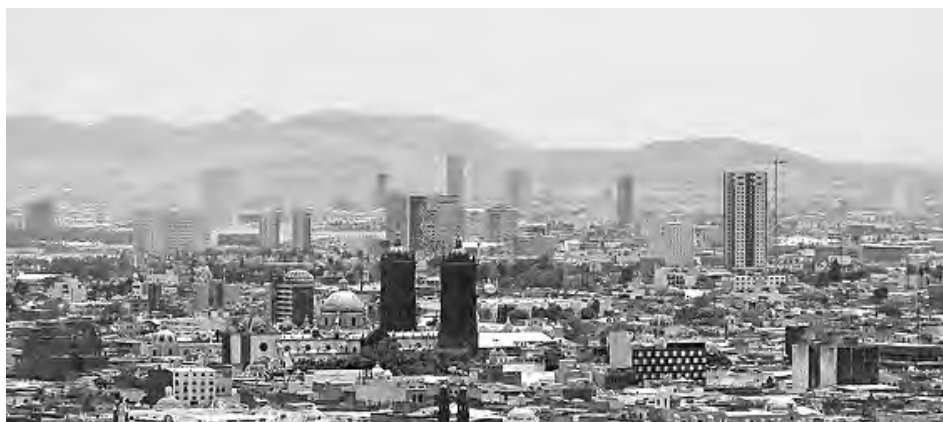
► Las capitales del Estado de México, Hidalgo y Puebla.