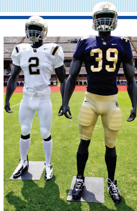
► Nueva piel.

“El grupo es muy maduro y siempre busca mejorar. No sentimos ninguna presión porque trabajamos para conseguir el bicampeonato, es nuestra gran meta en esta temporada. Habrá que demostrarlo en la cancha”, dijo el también jugador de quinto año.