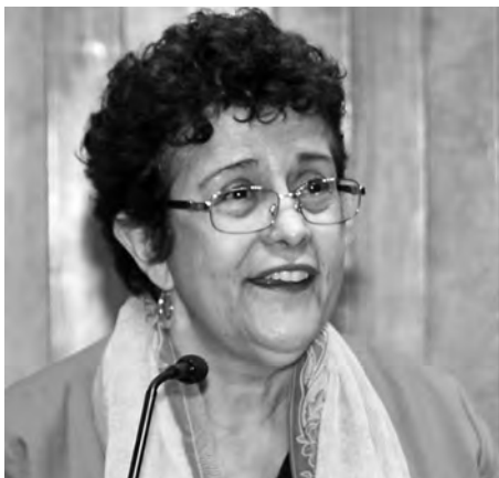
► La conferenciante.

Además, queda la duda de si se puede llegar a dicho estado por otros medios, como en la mística zen, “ajena al sentimiento trágico de la vida y apegada a una especie de inteligencia emocional”, o en las llamadas salvaje, profana o atea. “Para algunos especialistas, el rasgo más notable de la experiencia mística –excepto en la judía– es la inefabilidad, es decir, la imposibilidad de describir con