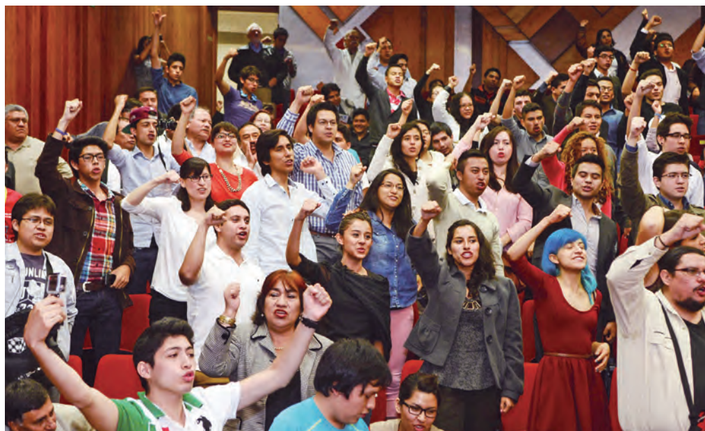
► Ideas que se convierten en soluciones.

Primero, Hack UNAM fue un extraordinario ejercicio donde se reunió a, por lo menos, un representante de todos los planteles, para que en una jornada de 48 horas continuas pudieran generar