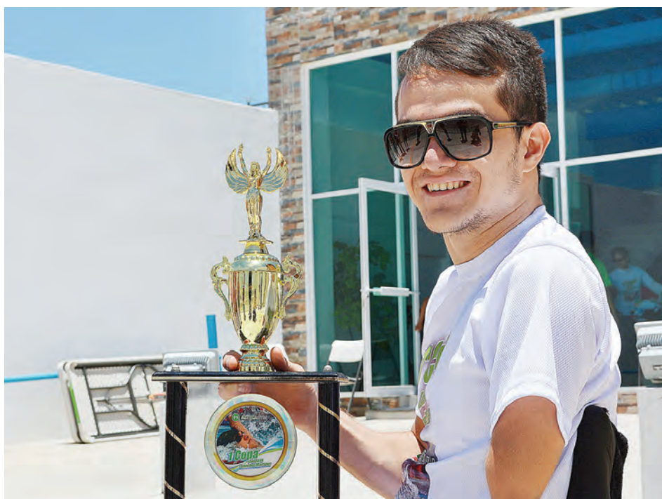
► El tritón auriazul se impuso en el Pan Pacific Para-Swimming Championships.

La delegación mexicana que participó en esta justa terminó en el quinto lugar de la clasificación, con 44 preseas: 14 de oro, 14 de plata y 16 de bronce, entre 17 naciones.