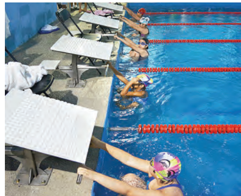
► Piscina en Perote, Veracruz, lleva su nombre.