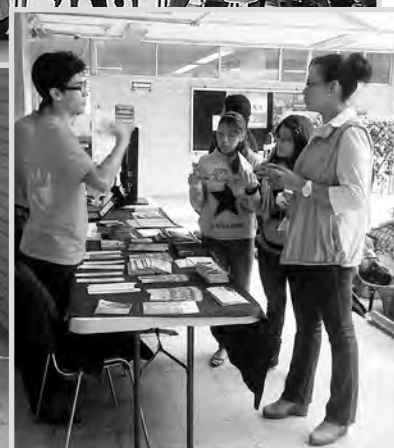
► En la ENEO.

ensayo de primeros pasos y armado de una coreografía breve.