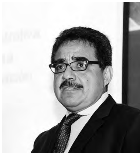
► El titular.

En el Centro se cultivan 14 áreas de investigación: lógica y fundamentos, combinatoria algebraica, teoría de números, geometría algebraica, teoría de represen-