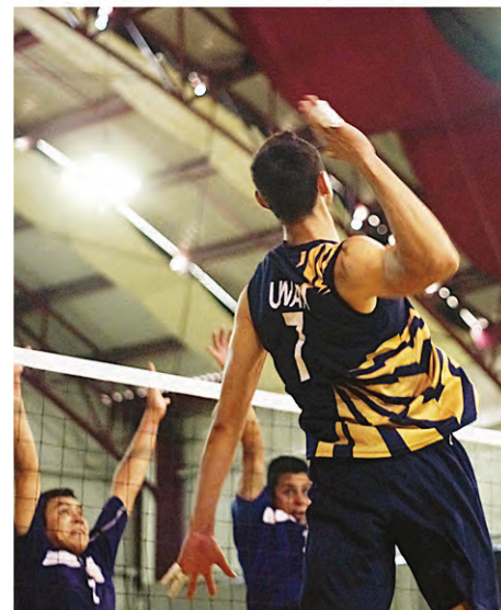
► Representó a México en tres universiadas mundiales.