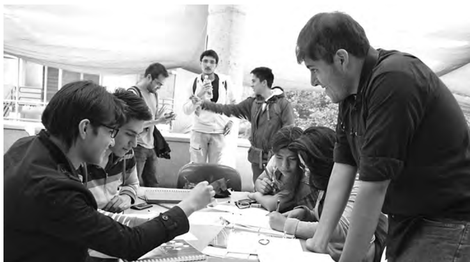
▶ México requiere de economistas actualizados.

Recibió la Medalla Alfonso Caso como egresado más sobresaliente de la maestría en Historia en 2002 y fue segundo lugar del Premio Jesús Silva Herzog de Investigación en Economía 2003, otorgado por el Instituto de Investigaciones Económicas. En 2006 obtuvo el Reconocimiento Distinción Universidad Nacional para Jóvenes Académicos en el área de Docencia en Ciencias Económico-Administrativas y en 2009 la misma distinción, pero en Investigación en Ciencias Económico-Administrativas. g