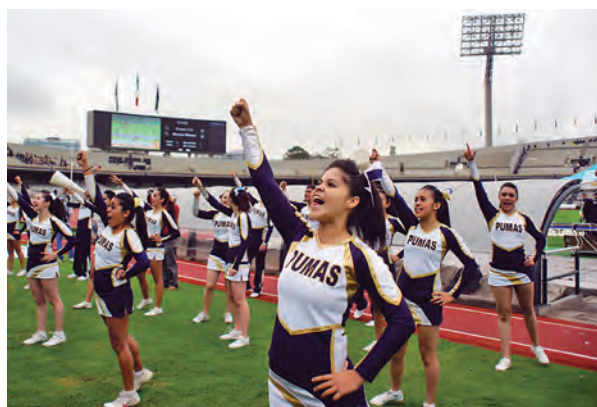
► Más preparadas.

Diez integran la selección que representará a México el 24 y 25 de abril