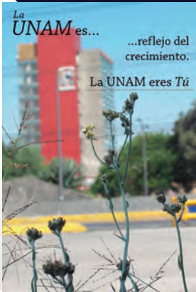
La UNAM es... ...reflejo del crecimiento. La UNAM eres Tú