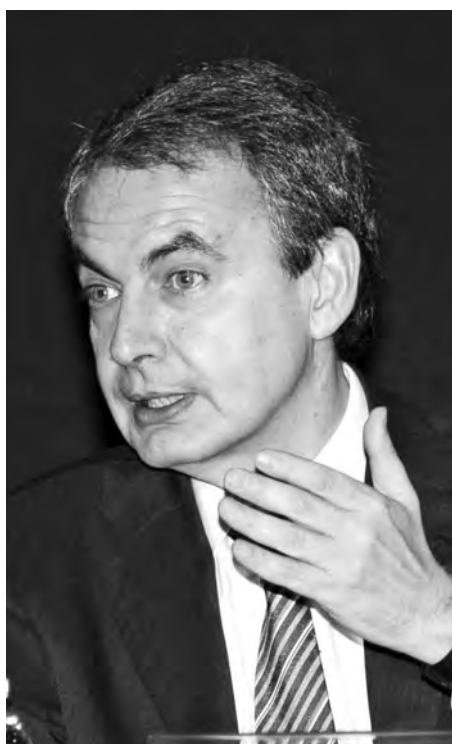
► El expresidente del gobierno español.