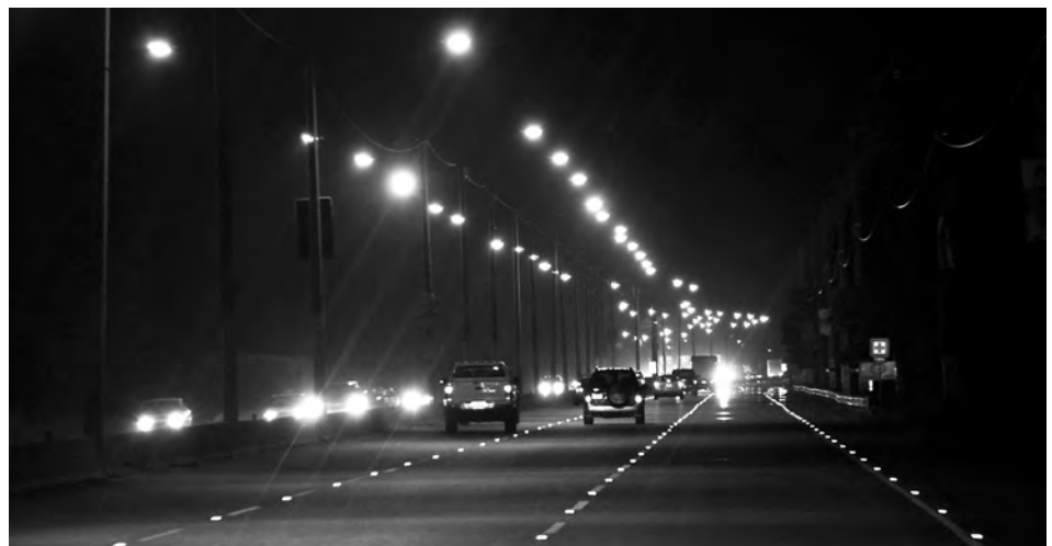
► Las actuales luminarias, ineficientes y de alto costo.

Se trata de cuatro dispositivos innovadores; dos de ellos con patentes aprobadas