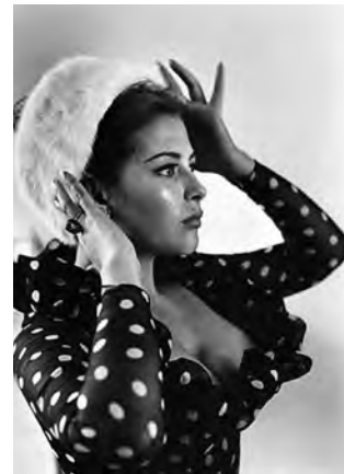
► El fotoperiodista (arriba el Che Guevara), Fanny Cano y Gabriel García Márquez.