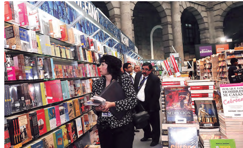
Diseño: Miguel Ángel Galindo Pérez.