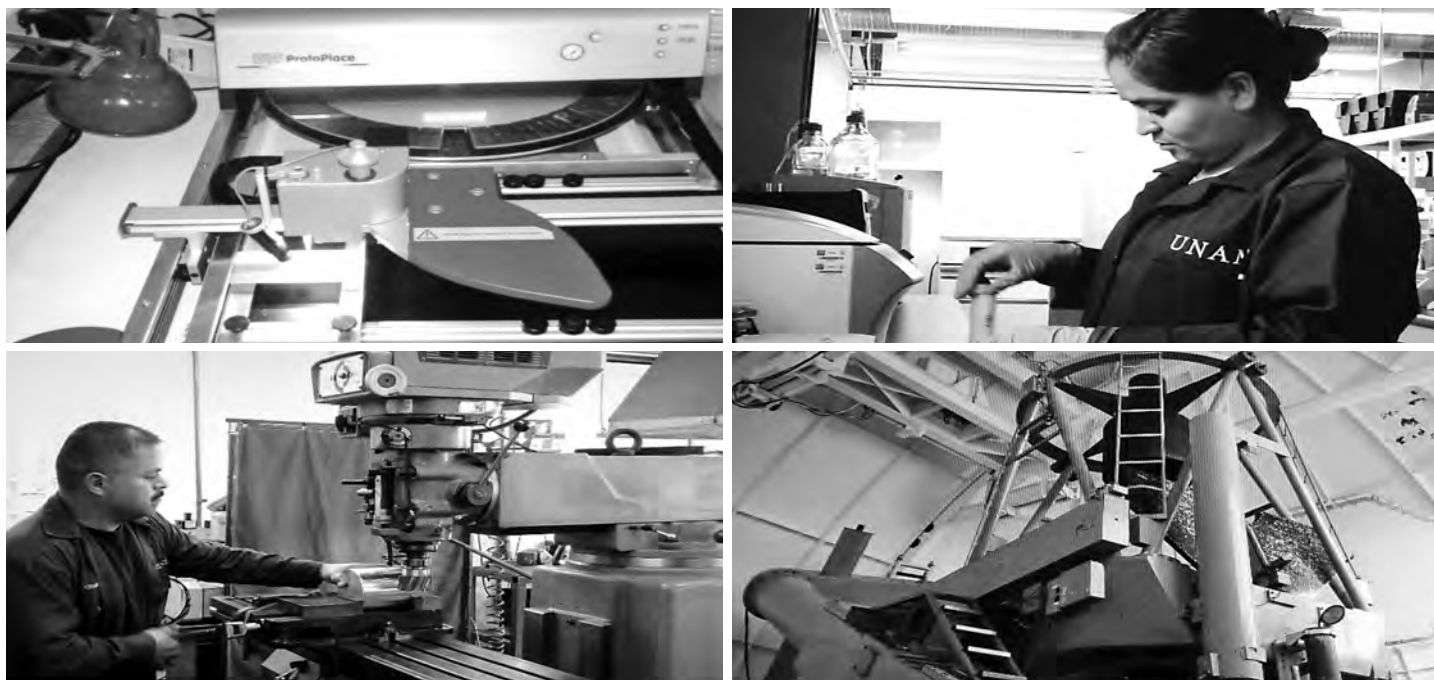
► Se fortalecen las actividades sustantivas de la Universidad.