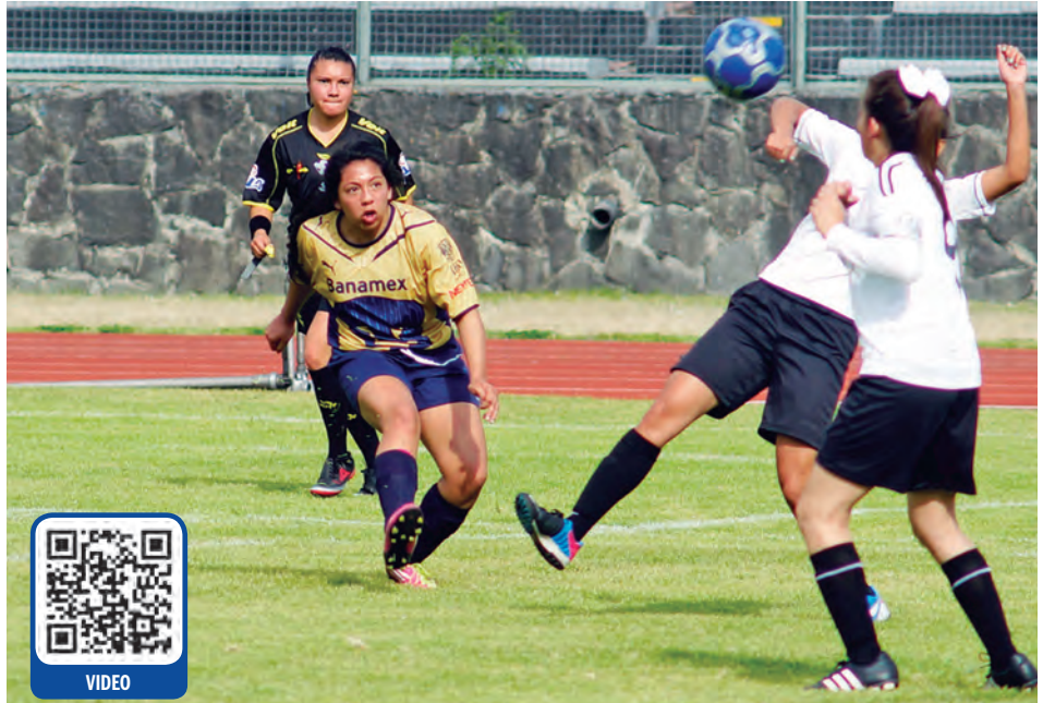
► Juego emocionante e intenso.