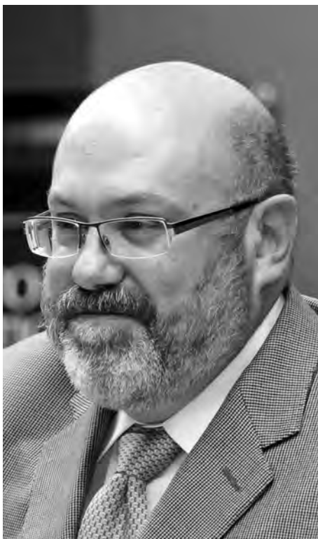
► El titular.

Durante el periodo comprendido entre el 1 de septiembre de 2012 y el 31 de agosto de 2013, académicos del Instituto iniciaron o realizaron 27 estancias de investigación, de las que 13 fueron visitantes provenientes de Alemania,