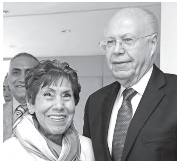
► Con el rector.

Frago Castañeda inició su tesis en 2001 y la concluyó en 2013. “Por mis múltiples ocupaciones siempre enmendábamos el proyecto y conforme cambiaba la ley debíamos adecuar el tema y el desarrollo del proyecto. Tenía que enriquecerla con nuevo material”. En septiembre pasado presentó su examen profesional. g