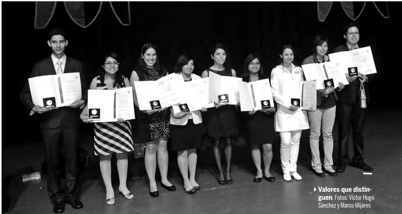
► Valores que distinguen.