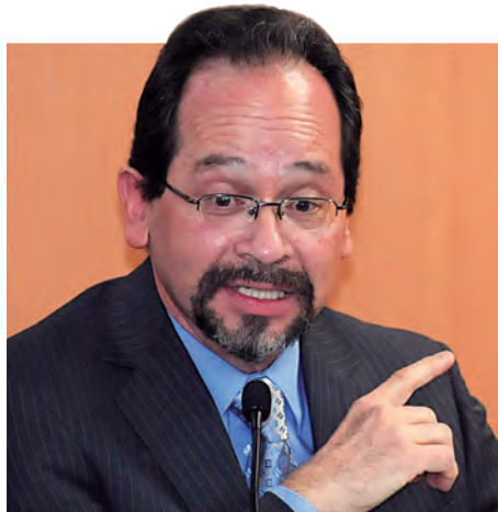
► Del CRIM.

Sin embargo, abundó, “no es suficiente porque el problema es sociológico y lo