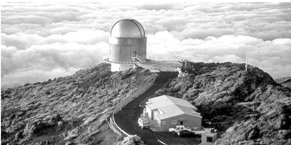
Imágenes obtenidas por el telescopio NOT.

Érika Benítez, del Instituto de Astronomía, publicó los resultados de este trabajo en The Astrophysical Journal