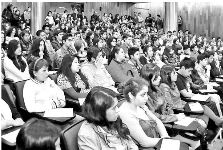
Expertos comparten conocimiento con estudiantes.

Se proporcionaron herramientas y elementos actuales del ejercicio de la ciencia jurídica