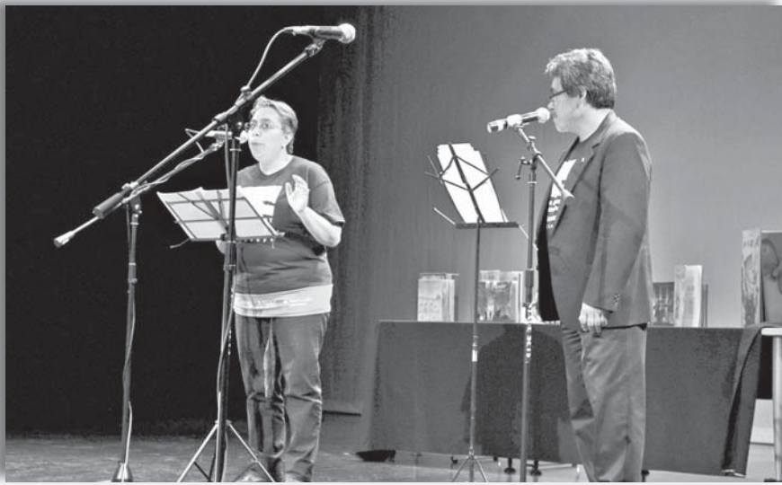
La presentación en la Sala Carlos Chávez.