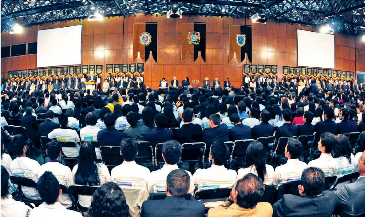
En el Centro Cultural Tlatelolco.