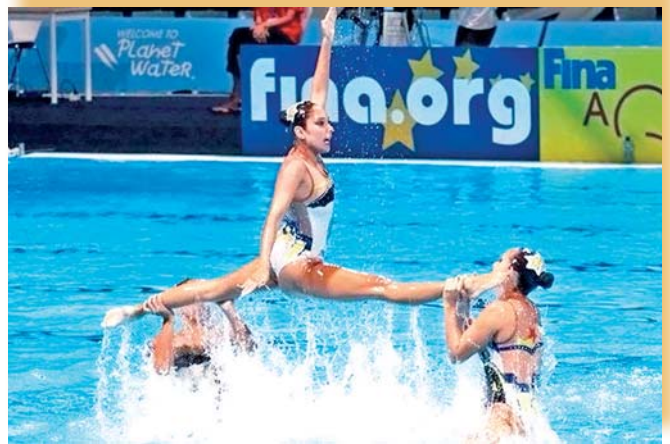
La alumna de la FES Acatlán.