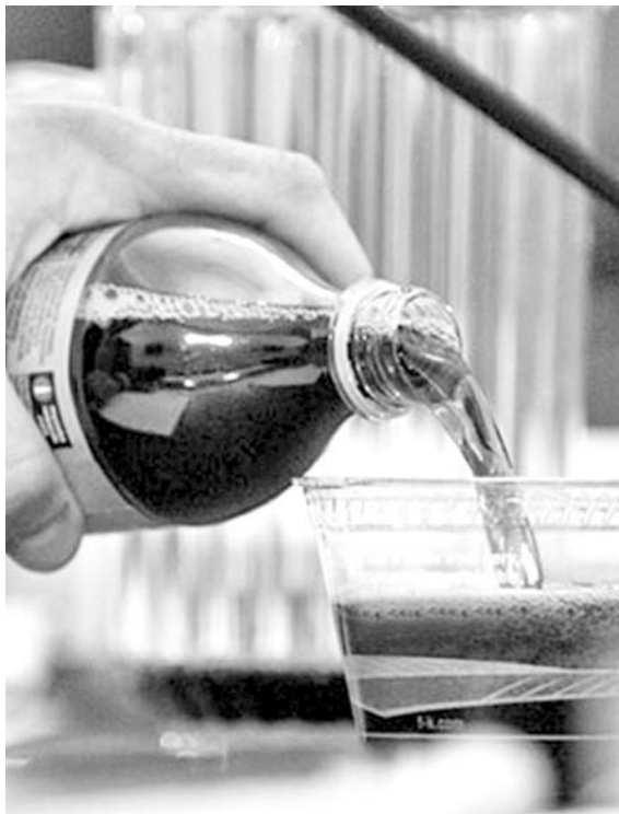
Para mejorar la condición habría que cambiar estilos de vida.