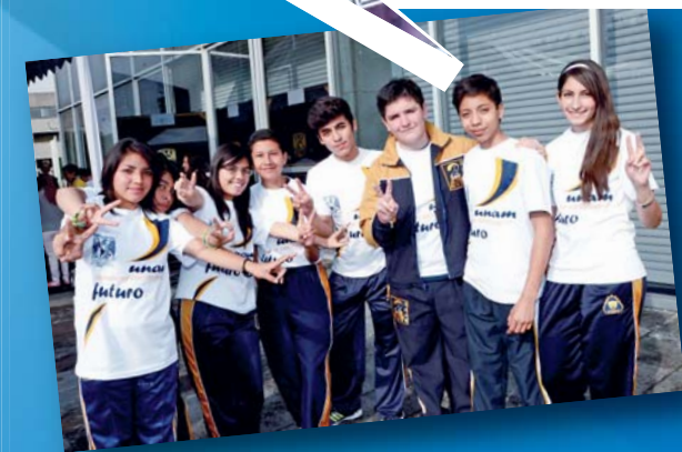
Fotos: Benjamín Chaires, Juan Antonio López, Fernando Velázquez, Víctor Hugo Sánchez. Diseño: Oswaldo Pizano.