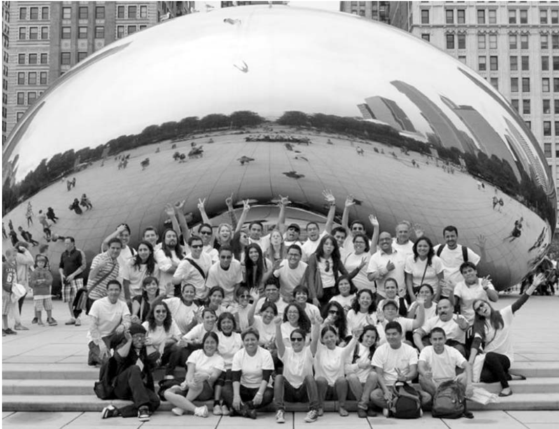
El viaje incluyó actividades culturales.