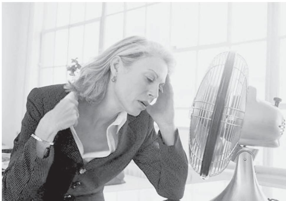
Se combate la degeneración y muerte de células.

Funcionan como antioxidantes y mejoran la calidad de vida de las pacientes