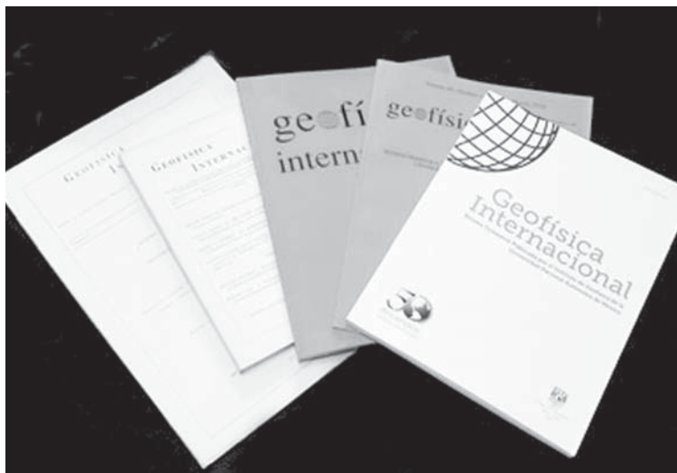
Publicación del Instituto.

la instalación del Museo de Geofísica en la vieja estación central del Servicio Sismológico Nacional.