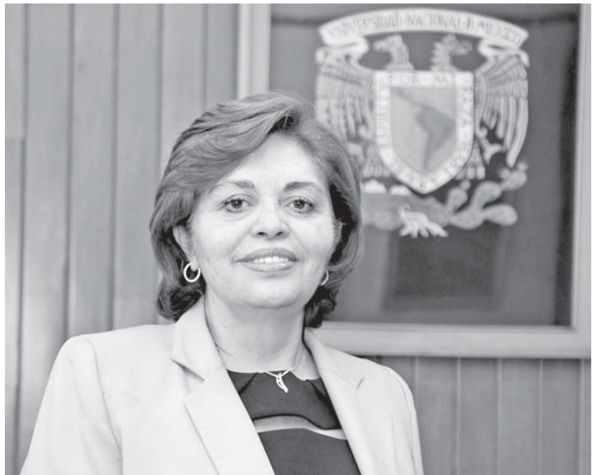
La historiadora.

seminarios en los niveles de licenciatura (sistema escolarizado y abierto) y posgrado.