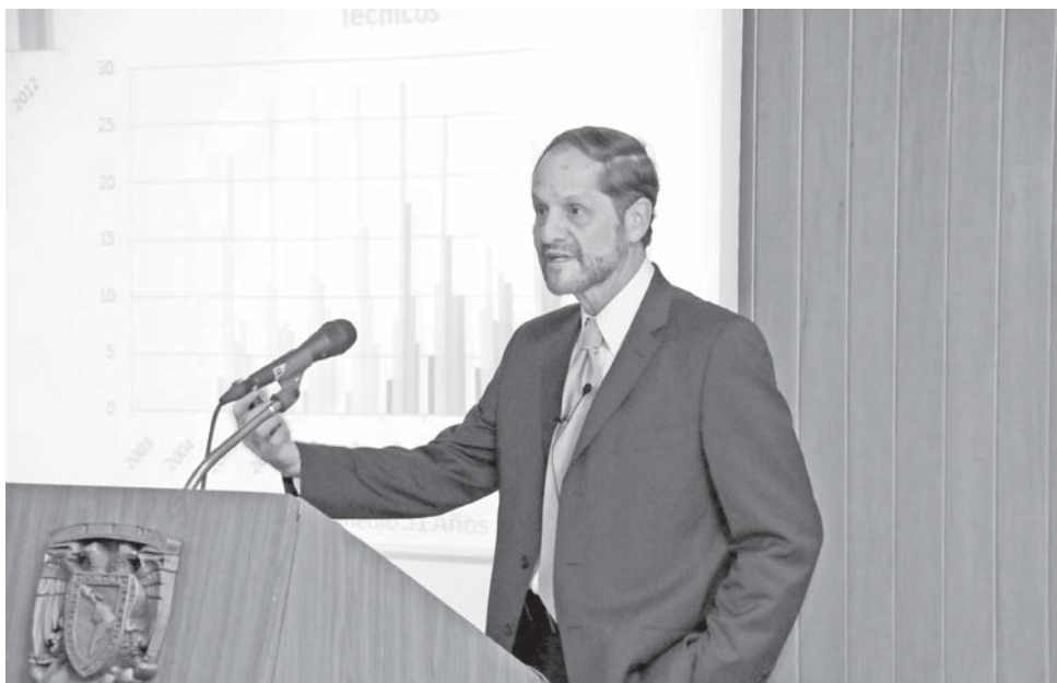
El titular.

coordinador de la Investigación Científica de esta casa de estudios, se mencionó que de 2005 a 2012 el personal académico pasó de 114 a 131 (70 investigadores y 61 técnicos académicos).