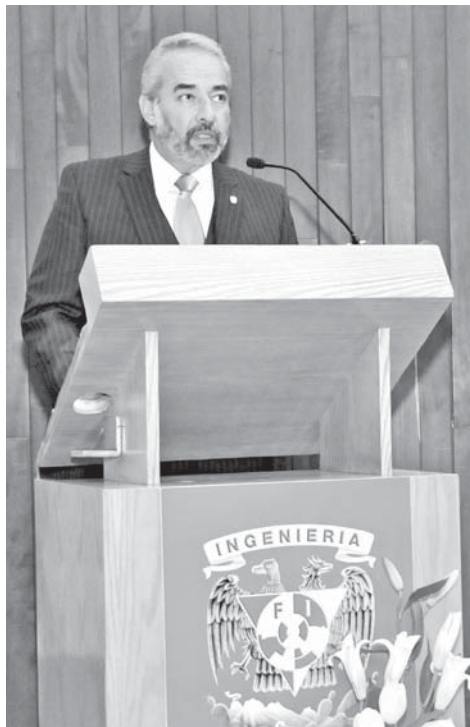
En el Auditorio Javier Barros Sierra.

Para apoyar la formación integral de los estudiantes, y en un esfuerzo inédito, arrancó un programa de becas completas para el aprendizaje del idioma inglés en todos sus niveles, en las modalidades presencial y en línea, auspiciado