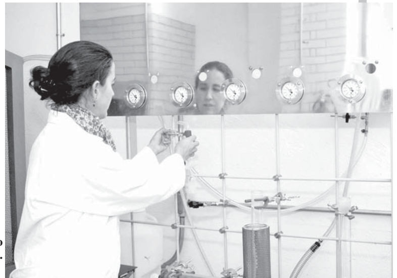
Laboratorio Universitario de Radiocarbono.

Asociación Latinoamericana de Magnetismo, tienen una publicación electrónica llamada Latinmag .