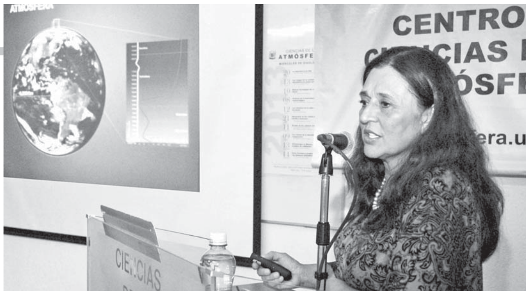
La directora del Centro de Ciencias de la Atmósfera.