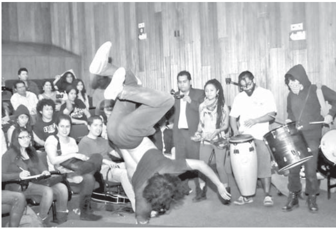
Grupo Dólar, mención honorífica.