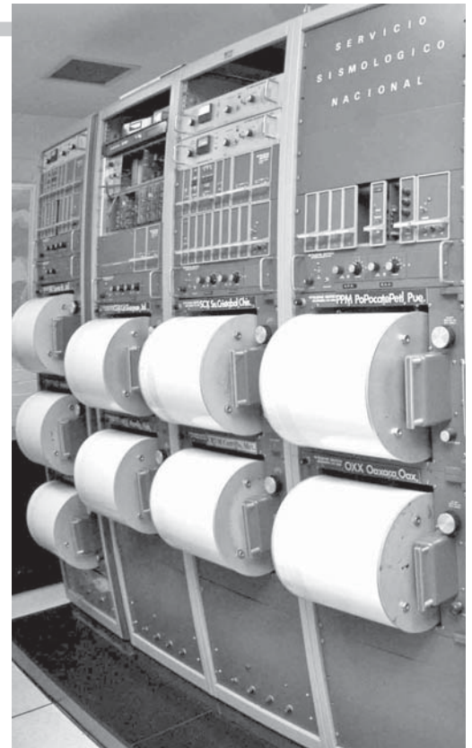
Servicio Sismológico Nacional.

“Tenemos los laboratorios de Paleoambientes, Análisis de Núcleos de Perforación, Termoluminiscencia, Cartografía Digital, Química Analítica, Sedimentología, Radioactividad Natural y el ICP-MS. También contamos con los observatorios de Rayos Cósmicos, Radiointerferómetro Solar, de Radiación Solar, Magnético de Teoloyucan,