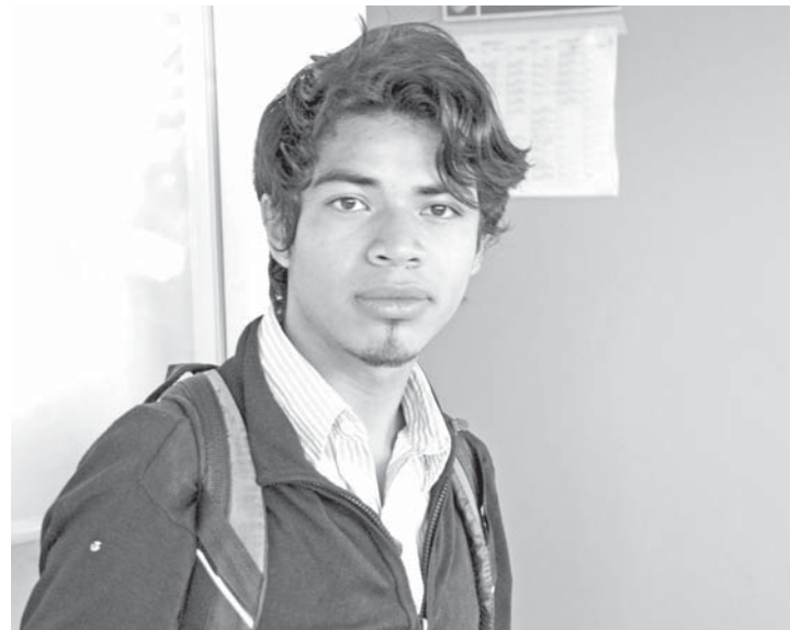
La academia, su refugio.

“Mi padre decidió que era más importante que lo ayudara en sus faenas que ir al colegio, así que sólo llegué al quinto año de