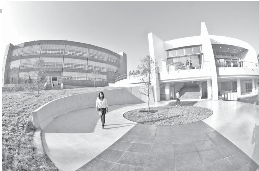
Importante participación de la ENES.

El segundo acuerdo, firmado con la Secretaría de Cultura del estado, tiene por objetivo establecer las bases de cooperación entre las partes para lograr el máximo aprovechamiento de los recursos en el ámbito de sus respectivas competencias e impulsar acciones conjuntas