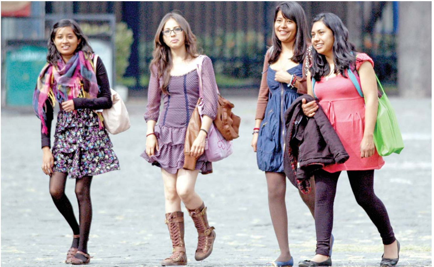
Aumentó su participación en la economía de 17 por ciento, en 1970, a 39 por ciento, en 2010.