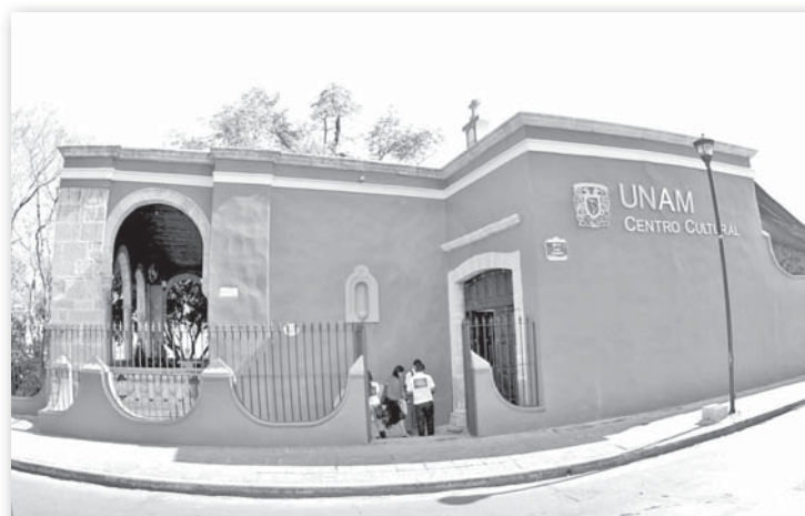
Instalaciones del nuevo recinto universitario.