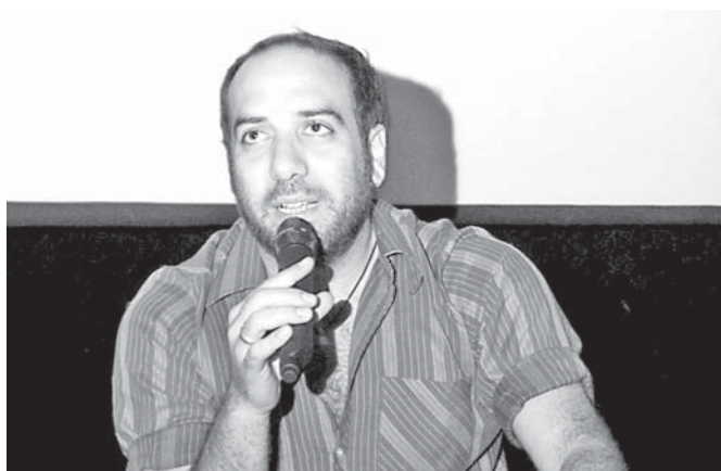
El mejor realizador.

Filmada con un presupuesto mínimo y ganadora del premio de la crítica internacional en el Festival de Locarno en 1962, En el balcón vacío no tuvo un estreno comercial en México y sólo fue conocida por medio de una copia en 16 milímetros propiedad de la Filmoteca de la UNAM, y que finalmente debido a un arduo proceso de restauración de imagen y sonido se vuelve a exhibir. g