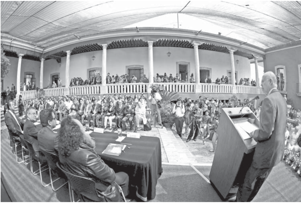
En el recién inaugurado Centro Cultural de la UNAM en Morelia.