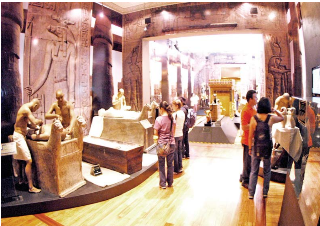
Palacio de la Autonomía.

En tanto, Miguel Ángel Mancera, jefe de gobierno del Distrito Federal, refirió que el