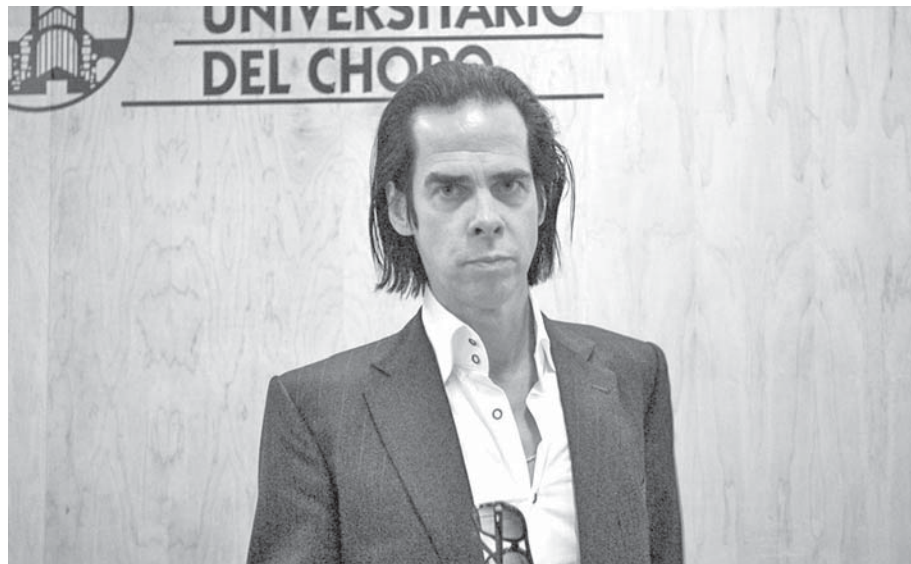
Icono del rock mundial.

novelas, Nick Cave ha sido parte de dos agrupaciones: The Birthday Party y, más recientemente, The Bad Seeds. Su música se caracteriza por un tono oscuro y siniestro, pero también por un interés hacia lo violento y lo erótico, con influencia de grupos y compositores como Tom Waits, PJ Harvey, Leonard