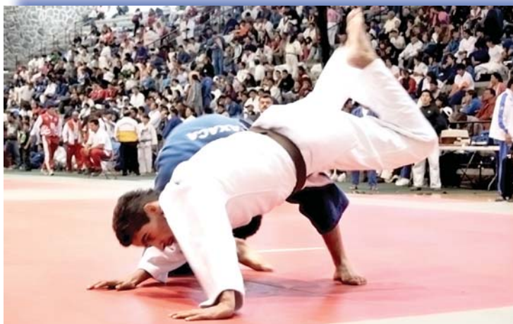
Participaron 700 judocas del país.