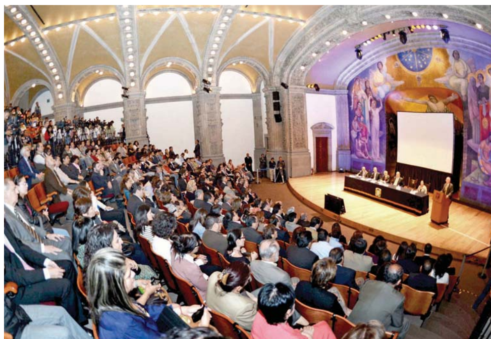
En el Anfiteatro Simón Bolívar.