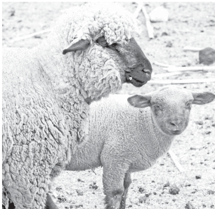
Cría por inseminación.

Veterinaria entregó 48 corderos, resultado de un proyecto de transferencia de tecnologías reproductivas