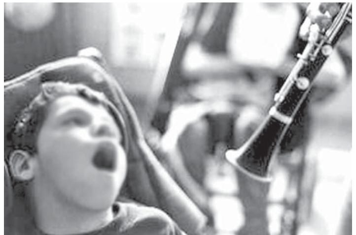
En el mundo del arte, la apreciación tiene gran importancia.

Si alguien con conocimientos musicales escucha Margarita en la rueda , basada en el Fausto , de Goethe, se dará cuenta que tiene cierta estructura y sabrá apreciarla, también, desde un punto de