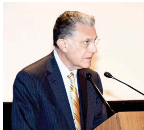
Rafael Moreno Valle.