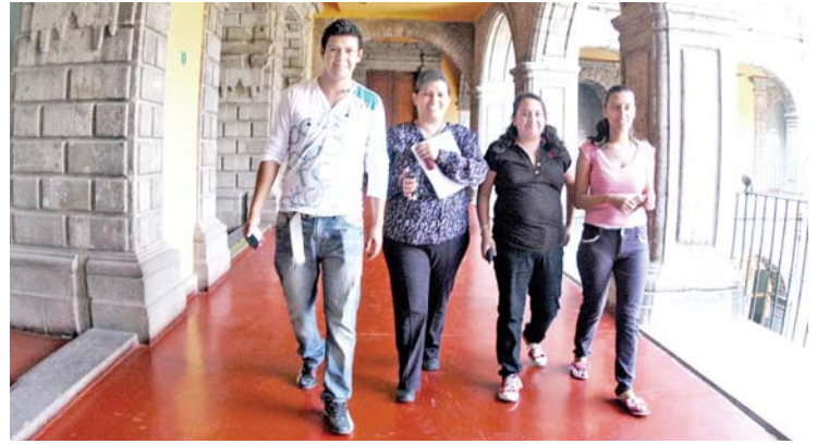
Espacios fundacionales: la Antigua Escuela de Medicina, el Palacio de Minería y San Ildefonso.