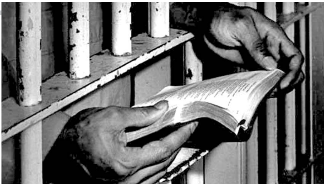
Lograr la justicia, verdad y reparación del daño.

Lograr justicia, verdad y reparación a personas o colectivos afectados, analizar el marco histórico y jurídico de legislaciones que han pasado de respaldar a individuos vulnerados por regímenes militares y desapariciones forzadas, a hacer suyas problemáticas de migrantes, indígenas y mujeres, son algunos de los retos planteados en el ciclo de conferencias Los Derechos Humanos Hoy, organizado por el Programa Universitario de Derechos Humanos (PUDH).