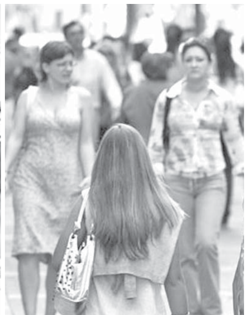
Se atiende ya la problemática de indígenas y mujeres.