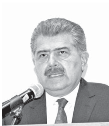
ospital General manuel Gea González”