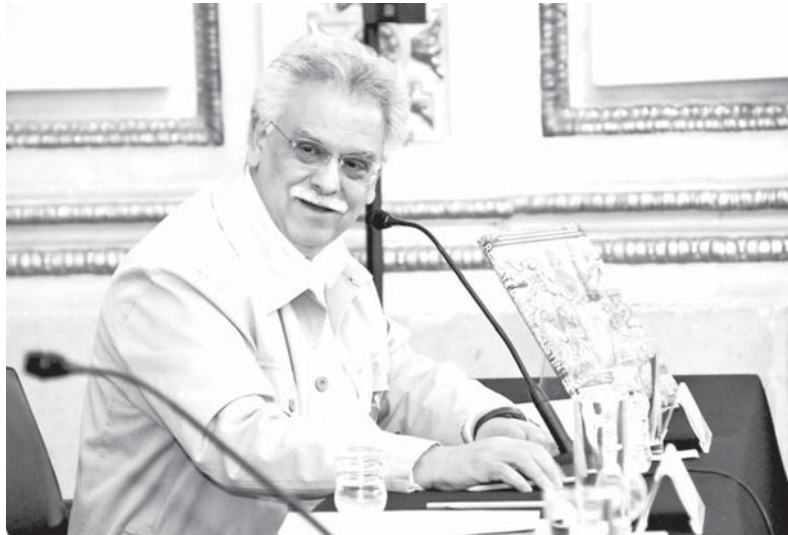
El autor.

En aquel edificio sobresalían el retablo del altar y la sillería del coro, que constaba de dos series, altas y bajas, que representaban 254 pasajes del Antiguo Testamento, basados en distintas ediciones de la Biblia publicadas en la época.