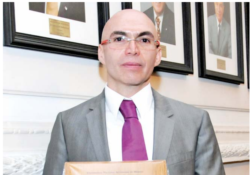
Orgullo y satisfacción.