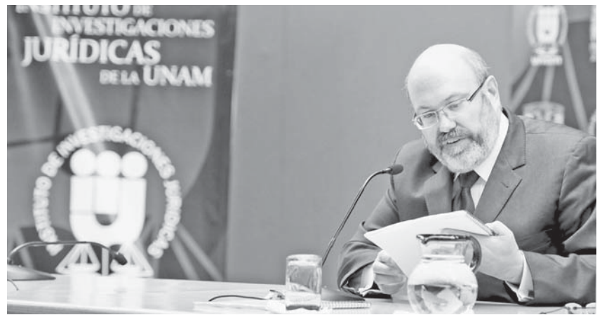
El titular en su segundo informe de labores.

También, en el Área de Investigación Aplicada y Opinión se realizó y concluyó, con el apoyo del Instituto Mexicano de la Juventud, la Encuesta Nacional de Valores de la Juventud 2012, para conocer con precisión las percepciones, actitudes y opiniones de ese sector sobre un gran número de temas que les conciernen, recalzó.