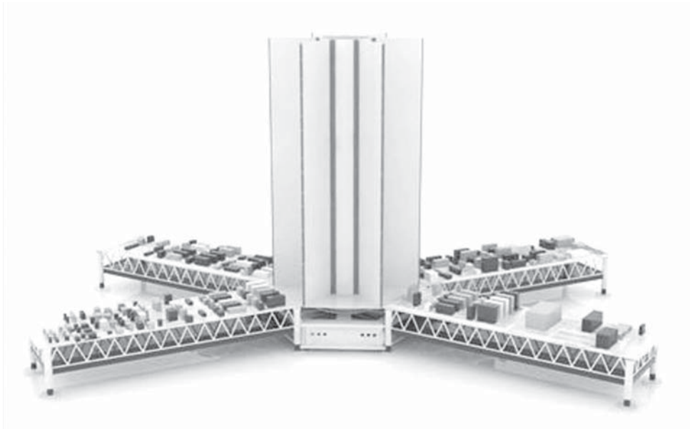
Solución al problema del Reemplazo Tardío de Componentes.

Se llama Open Space y permite ahorrar tiempo y costos de producción