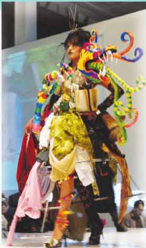
Merodeador de recuerdos