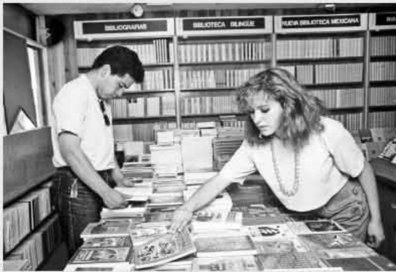
Librería, 1992. Foto: Jesús Eduardo López Reyes, IISUE/AHUNAM/ Colección UNAM, Imágenes de Hoy, LJ 006.