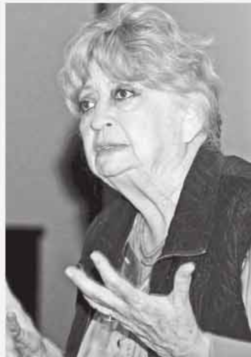
La filósofa expresó que los ideales de los ambientalistas deben llevarse a la práctica.

"La conciencia ecológica nos da una lección a quienes nos dedicamos a la ética y creíamos que sólo había responsabilidad de los humanos con los humanos", destacó la filósofa en el Auditorio Carlos Graef, de la Facultad de Ciencias.