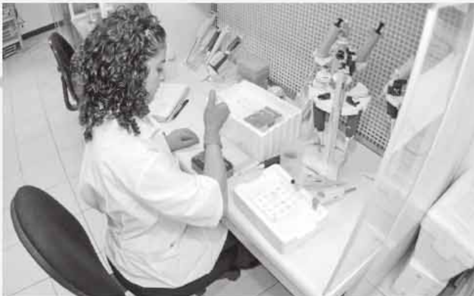
Un reto, incidir en el desarrollo tecnológico.

Además, 60 por ciento del territorio nacional está erosionado; por ello, se requiere el establecimiento de plantas, que es la manera natural de retener suelo y de filtrar agua de lluvia para formar reservas hídricas en el subsuelo, finalizó Monroy Ata. J