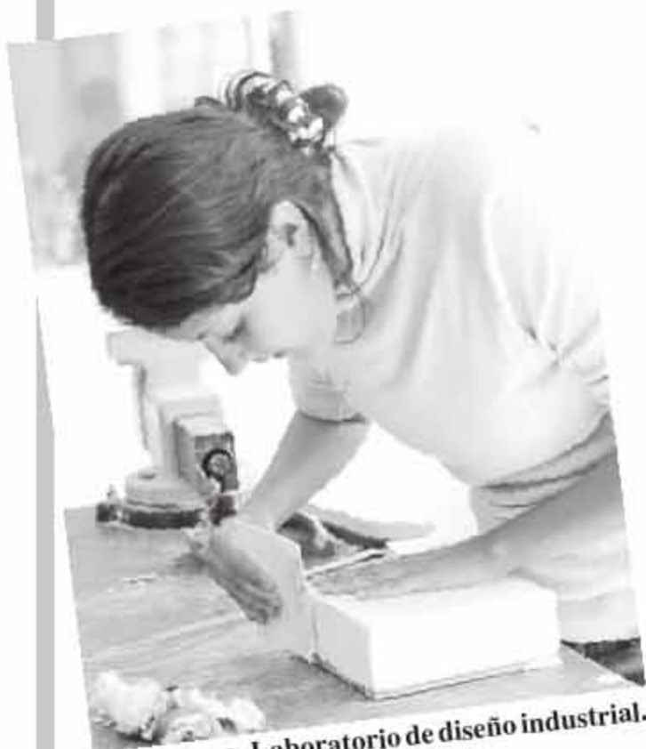
MOLDEADO. Laboratorio de diseño industrial.