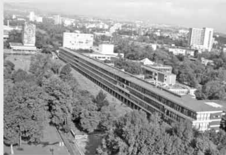
Facultades de Filosofía y Letras, Derecho y Economía, 2002.