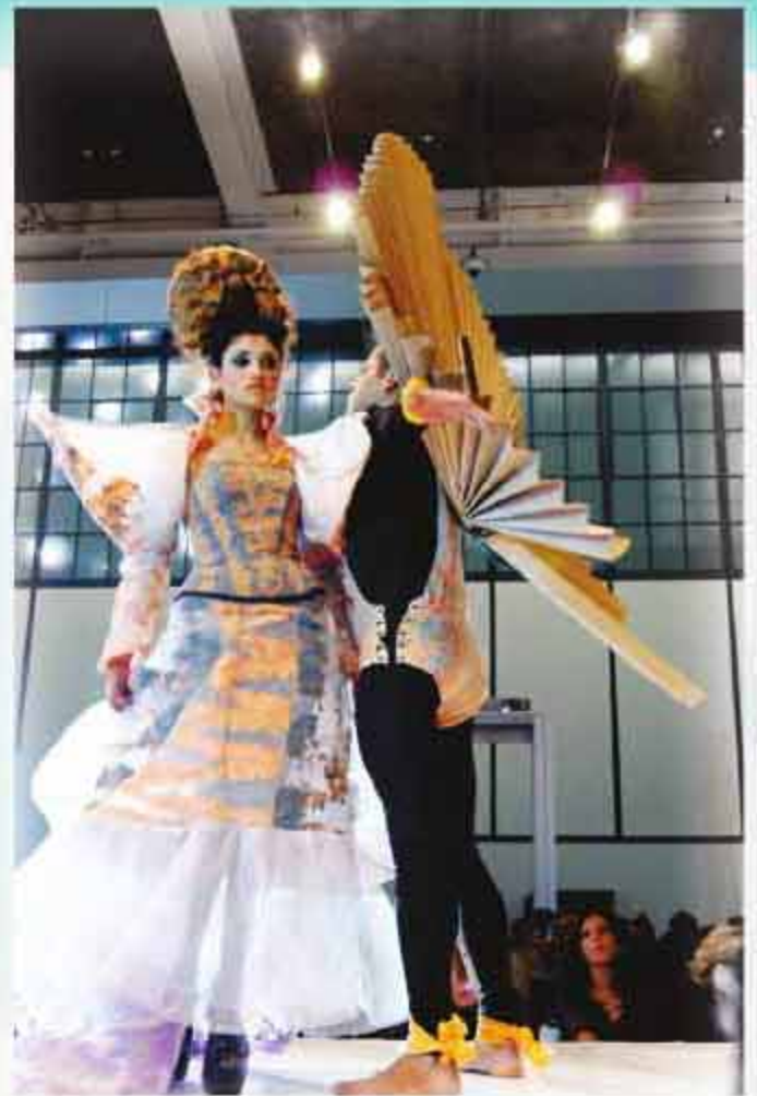
Itzihuapa y Mintzia