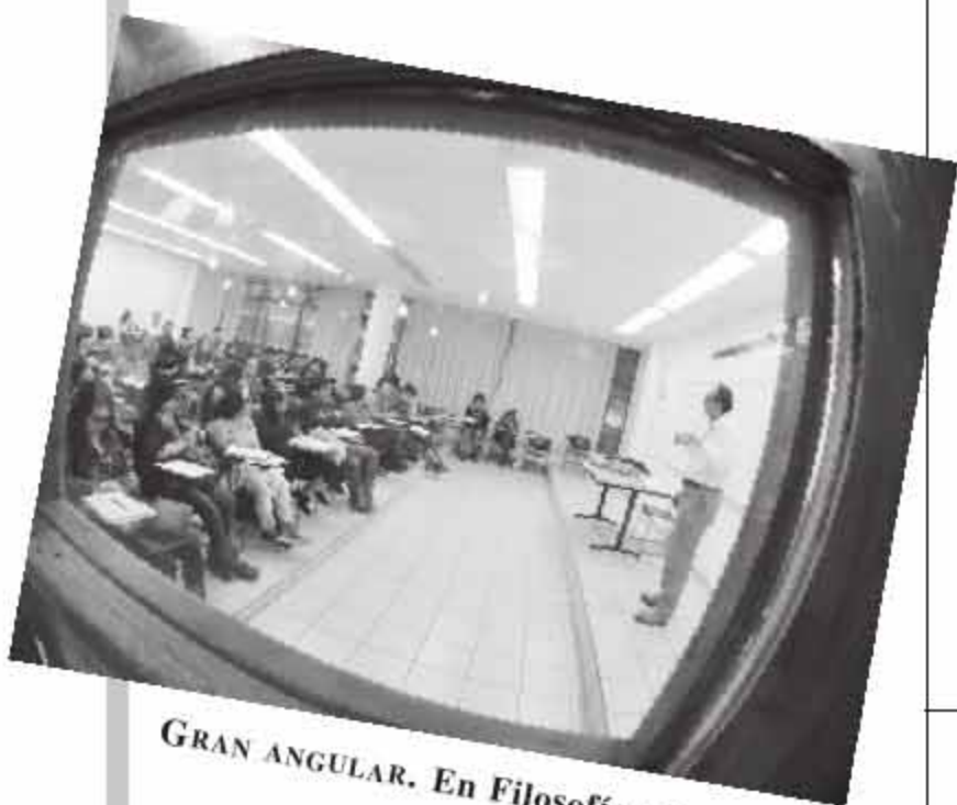
GRAN ANGULAR. En Filosofía y Letras.