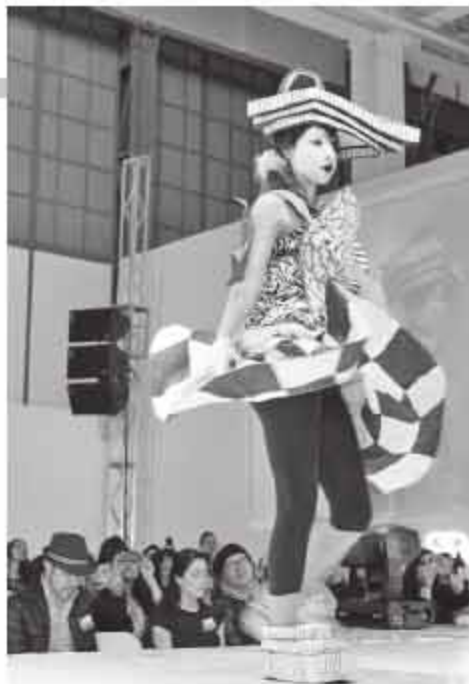
Micro-macro, de Samuel Martínez.