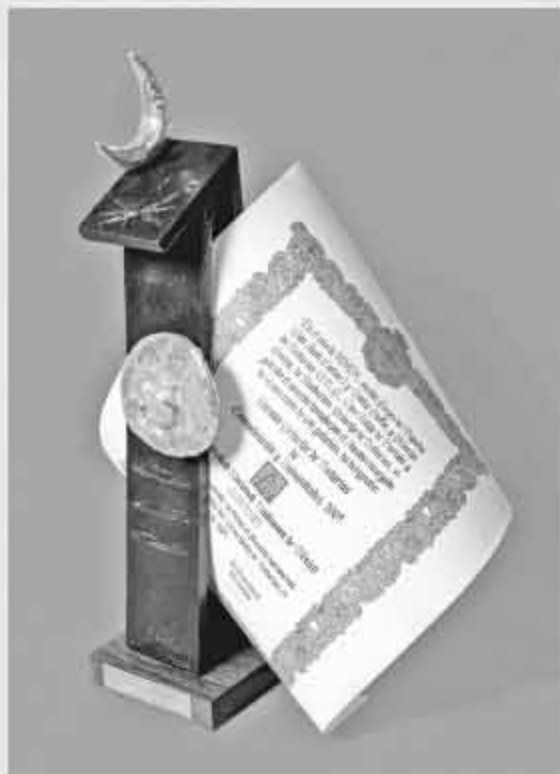
Estatuilla y pergamino del Premio Príncipe de Asturias, 2009.

MERCEDES DE LA GARZA CAMINO INSTITUTO DE INVESTIGACIONES FILOLÓGICAS