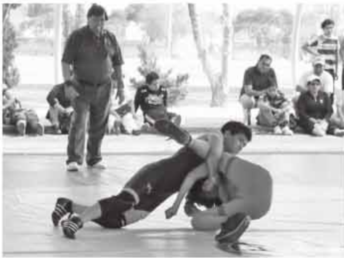
Participaron 69 universitarios en diferentes estilos.