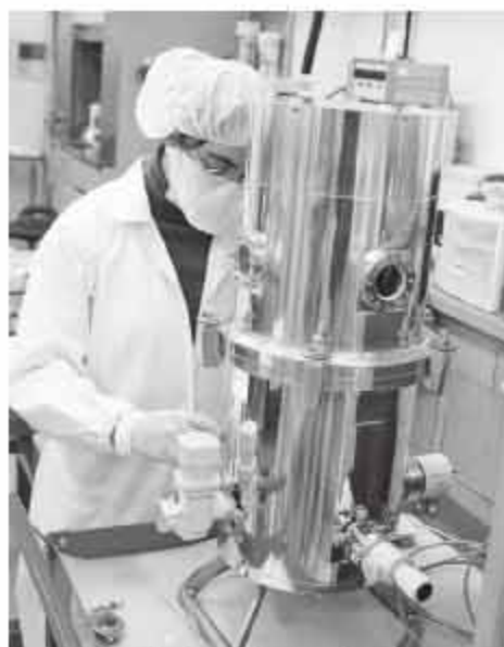
Departamento de Instrumentación.

Ha impartido más de 30 cursos en licenciatura y posgrado, dirigido tres tesis de licenciatura, una de maestría y dos de doctorado, y supervisado a tres investigadores posdoctorales. Actualmente analiza dos tesis de maestría y una de doctorado.