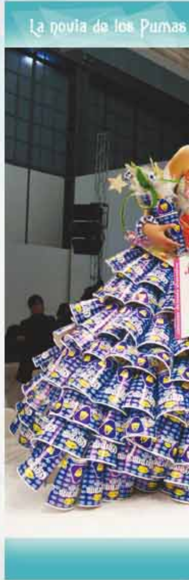
La novia de los Pumas