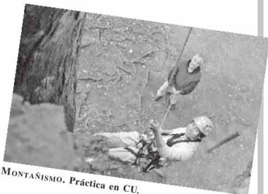
MONTAÑISMO. Práctica en CU.