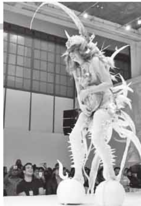
Hijo de Luna, segundo lugar.

C on un ameno desfile sobre una pasarela llena de luces y glamour , se realizó la premiación de la cuarta edición del concurso de moda alternativa .modales, organizado por el Museo Universitario del Chopo.