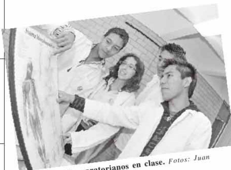
ANATOMÍA. Preparatorianos en clase.