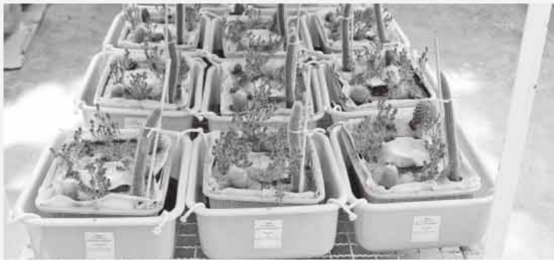
Contenedores autosuficientes para naturalizar azoteas, tienen como base jarros de barro.

rocas, lo que aumenta la adherencia al sustrato. Además, conectan las raíces de las plantas y forman gremios vegetales”, explicó.