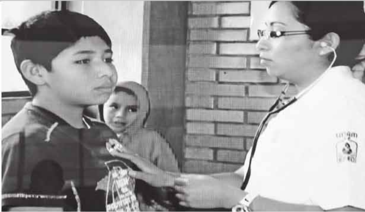
Atención a la comunidad.

y entidad impulsora de su fortalecimiento a siete años de su aprobación, hoy es considerada una opción de calidad para la formación de maestros universitarios, y de enfermeras clínicas que incursionan en la investigación, la gestión de servicios y en los sistemas de salud.