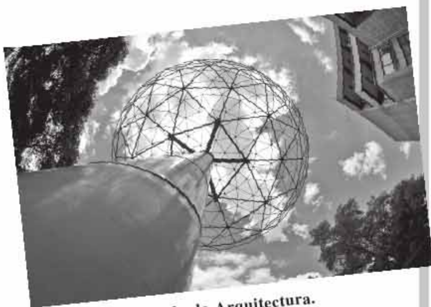
ESCULTURA. El cielo de Arquitectura.