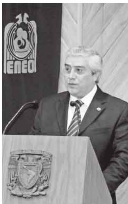
Se cuenta con 71 convenios.

todas las áreas de docencia y servicios a estudiantes, biblioteca, cómputo,