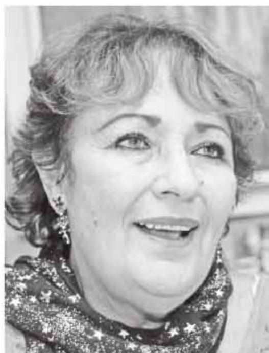
Estrellifera por vocación.

No hay ninguna disciplina científica, salvo la genética, que haya evolucionado tan vertiginosamente