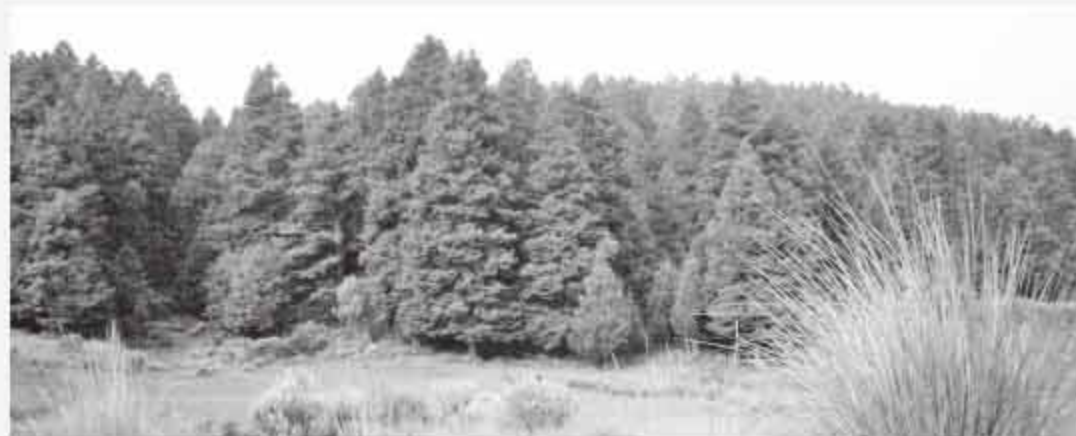
El cuidado del planeta es una responsabilidad colectiva.

El medio fundamental para promover la ética ambiental es la educación. Por un lado está la formal, que va desde la básica hasta la universitaria; por otro, es preciso crear una cultura ecológica por medio de la televisión, internet, ecoturismo, políticas públicas, instituciones, investigación científica e innovación tecnológica. g