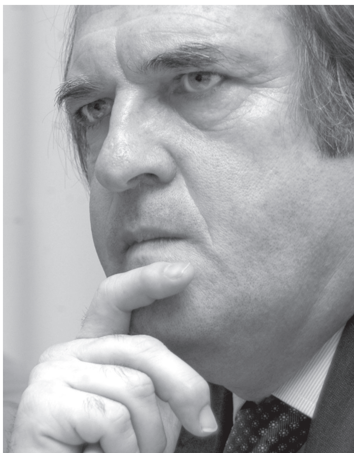
El catedrático español.

Para la propia académica, a quien Ángel Gabilondo recordó como una dama errante y desterritorializada en su vida y obra, quien