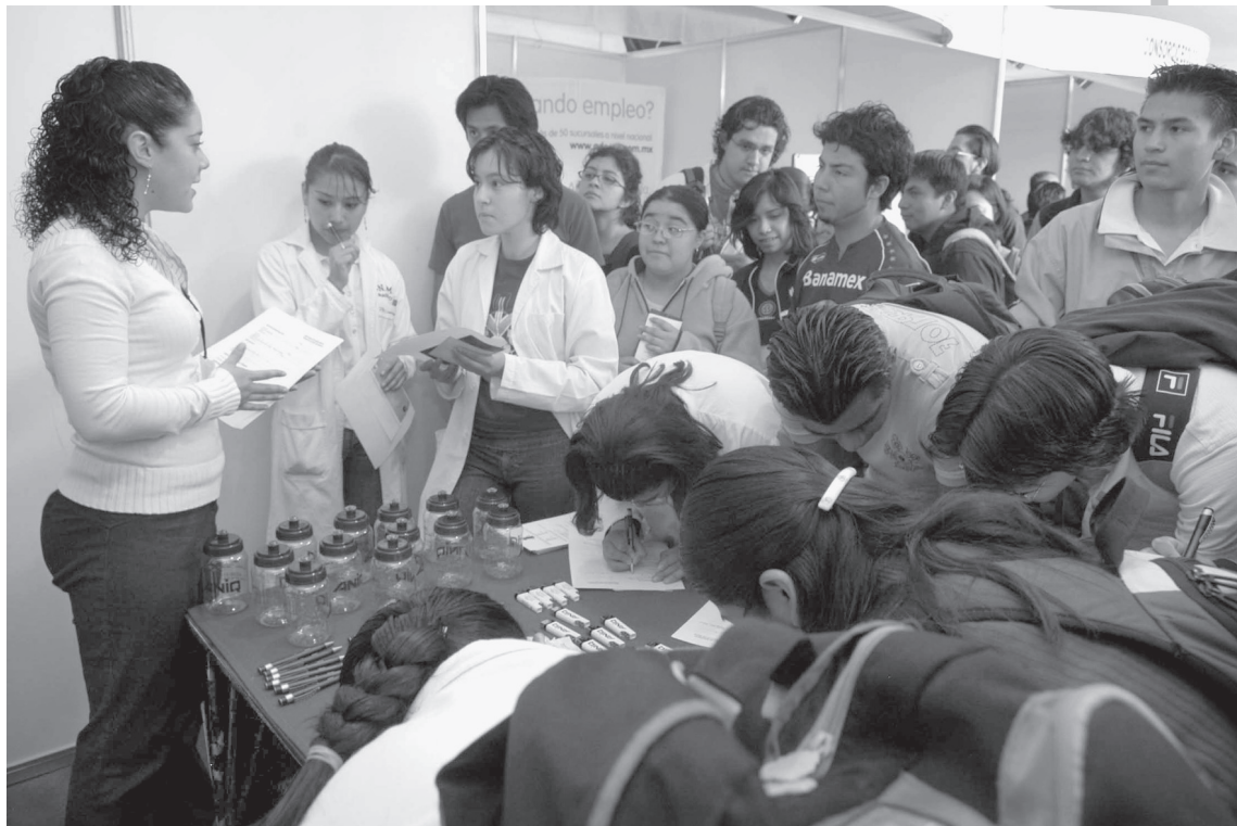
Visitantes al corredor laboral.