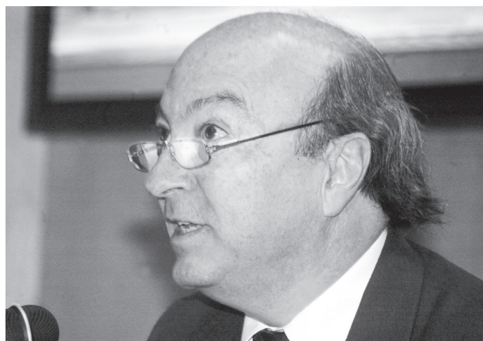
En el informe.

Basave Kunhardt señaló que 61 académicos imparten 96 cursos en