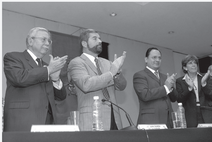
Durante la inauguración del congreso.

Se realizó el Décimo Congreso Nacional de la Academia Mexicana de Derecho Fiscal