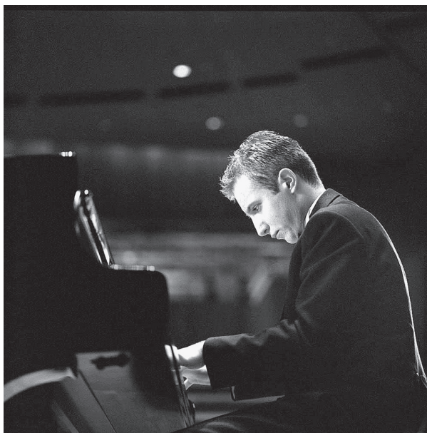
El pianista ucraniano.

En junio, el Miami String Quartet ejecutará dos recitales, el jueves 21 a las 20:30 horas, en la Sala Nezahualcóyotl, y el viernes 22, a las 20 horas, en la Sala Carlos Chávez. El jueves 5 de julio, a las 20:30 horas, la virtuosa pianista rusa Valentina Lisitsa interpretará en la Sala Nezahualcóyotl obras de Scriabin, Rachmaninov, Balakirev, Liszt y Tchaikovsky. Informes, al teléfono 5622-7113 o en la página www.musicaunam.net