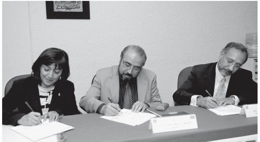
En la firma del acuerdo.