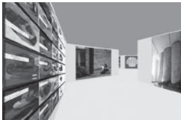
Exhibición I-dance .

Entre las imágenes destaca la de una elegante mujer que pasea entre los habitantes de una aldea tradicional africana; antes de sentarse al