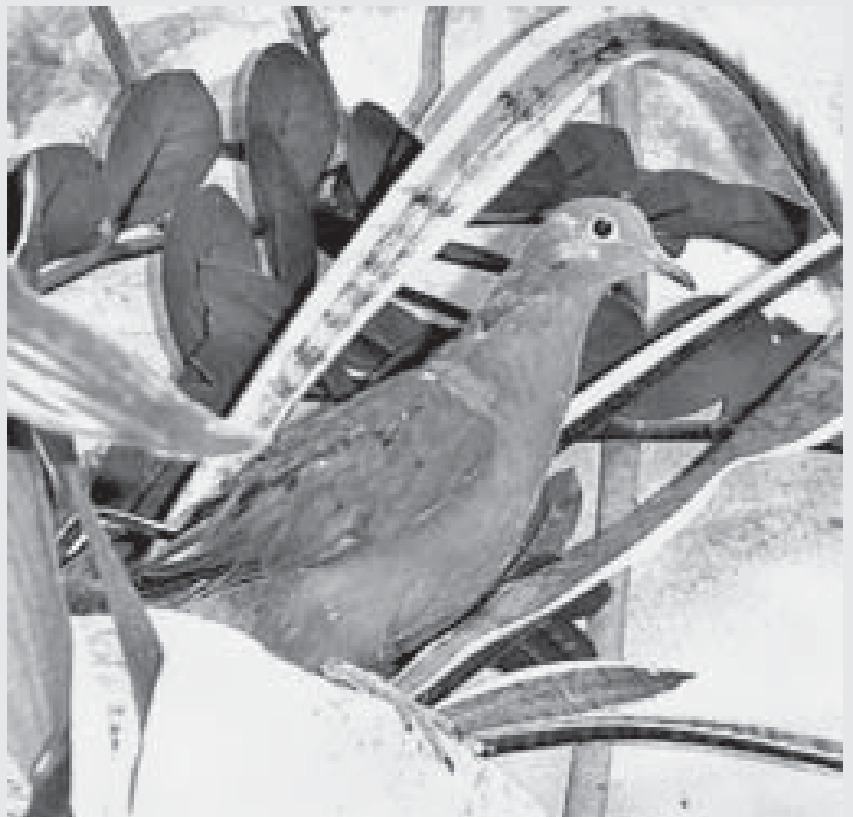
La paloma de Isla Socorro desapareció de su hábitat natural.

animales pueden estar sufriendo mayores casos de extinción o amenazas en México, como los insectos, anfibios, moluscos y otros por tener áreas de distribución más pequeñas; incluso muchas de sus especies desaparecen sin que lleguen a ser descritas. En el ámbito mundial se considera que 25 por ciento de las especies de mamíferos y de anfibios están en peligro; de los reptiles, 20 por ciento y de los peces, 34 por ciento. No obstante, aseveró Escalante Pliego con las aves la pérdida no es tan rápida debido a que sus zonas de propagación son más grandes.