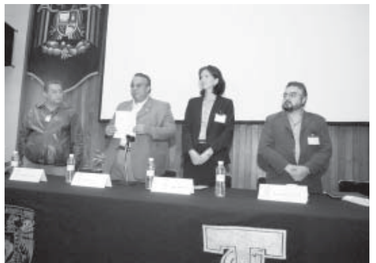
En la inauguración.

El foro internacional fue organizado por la Escuela Nacional de Trabajo Social, la embajada de Alemania en México, el Instituto Mexicano de la Juventud, el Centro Juvenil Promoción Integral y el Centro Caritas de Formación para la Atención de las Farmacodependencias.