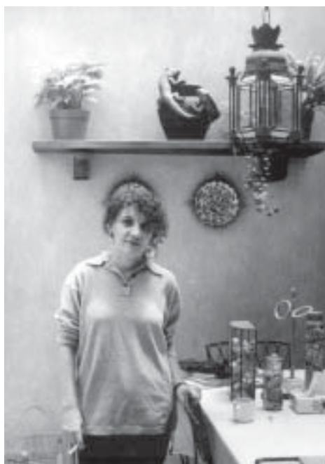
Margo Glantz.