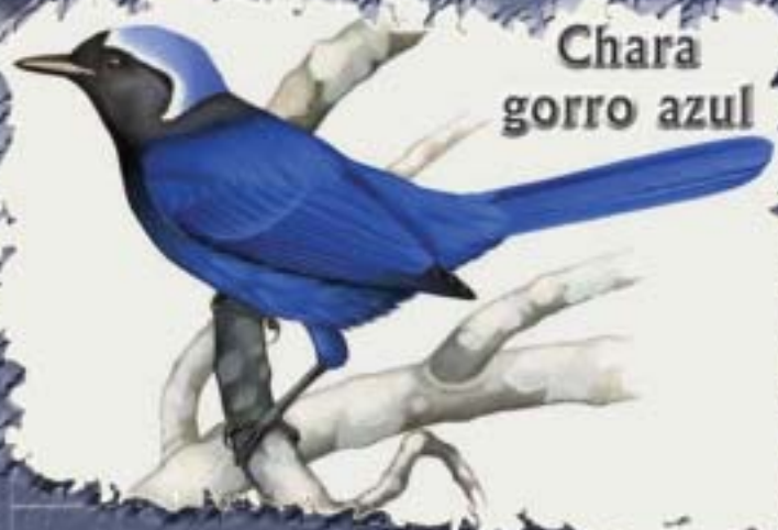
Chara gorro azul