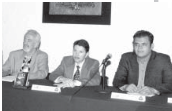
En la Unidad de Seminarios.

Para todos los interesados en adquirir el material discográfico del