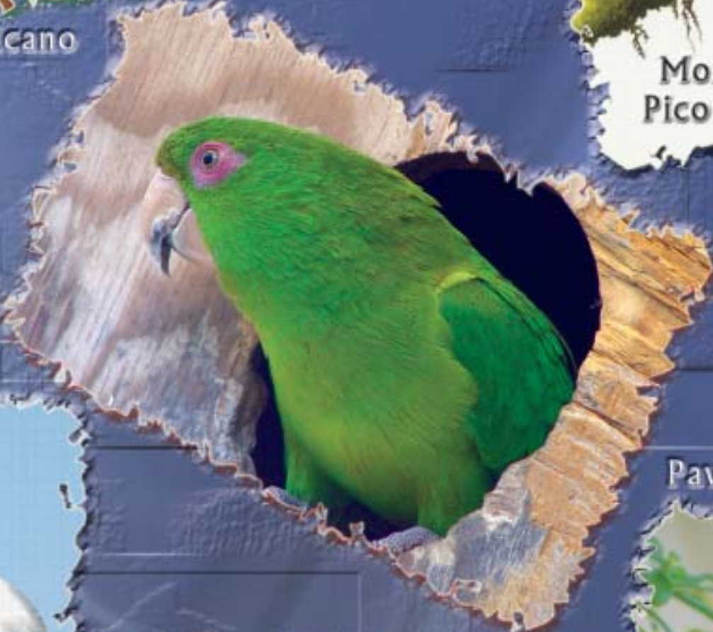
Perico de Socorro