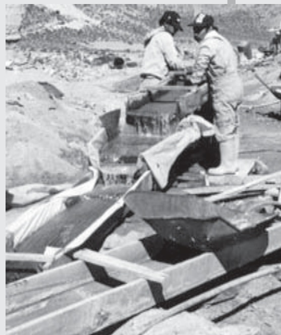
Las jornadas de trabajo no se respetan en muchos lugares.