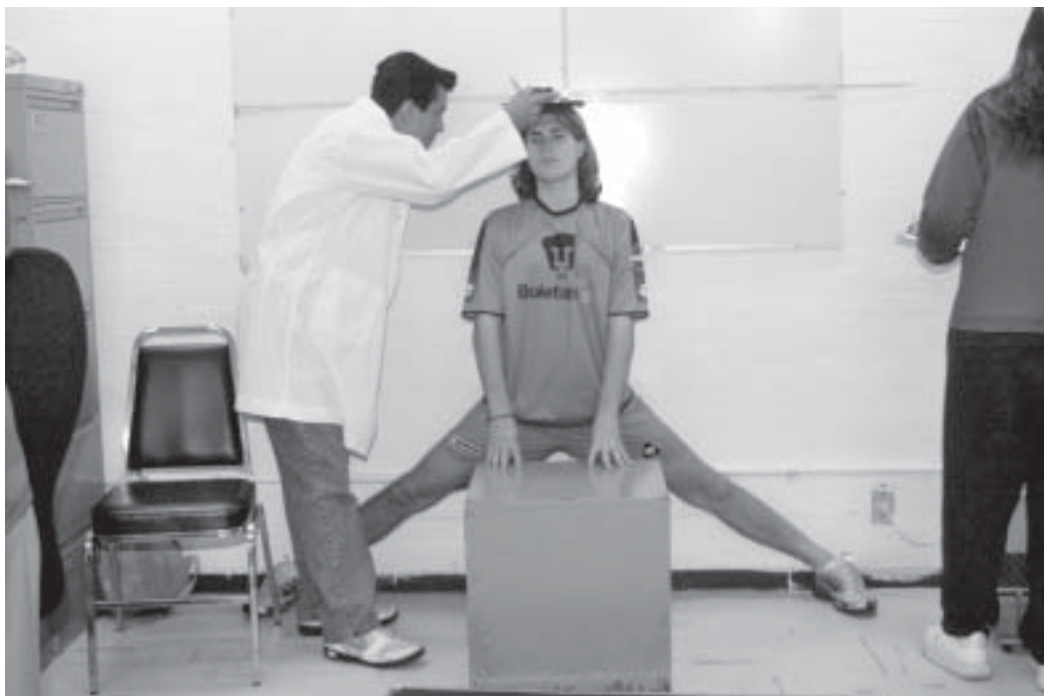
En México no hay muchos especialistas en el área de la salud.

Es el único en América Latina; participan la Escuela Nacional de Enfermería y Obstetricia y Medicina del Deporte