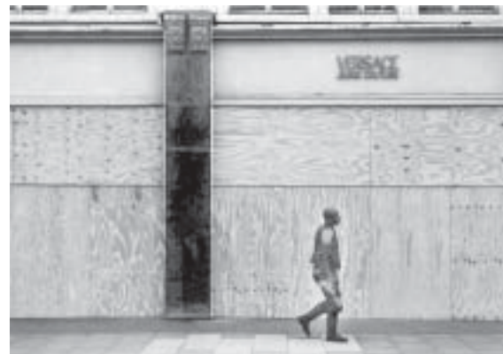
Muestra May day .

Con el propósito de encontrar una línea narrativa en las relaciones interpersonales originadas por la casualidad o la catástrofe, Pierre Giner presenta I-dance , exposición que pretende captar –en esos espacios de encuentro– el intercambio y el diálogo por medio de instalación multimedia, video, Internet, juegos de video y telefonía celular.