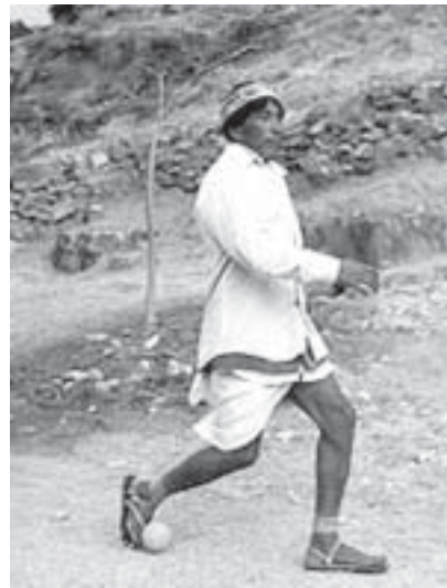
También conocida como rarajipumi.

donde las tarahumaras lanzan un aro con un bastón con el objetivo de llevarlo a una meta establecida antes de la carrera. Como sucede en el juego de la bola, son dos equipos de cuatro a 10 corredoras donde también se apuesta.