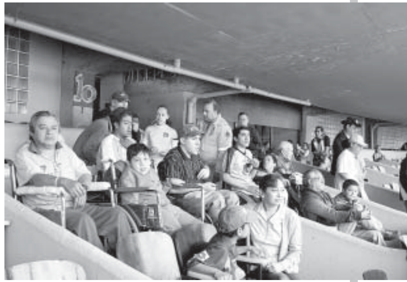
Un grupo de personas especializadas en protección civil las acompañan durante todo el evento.