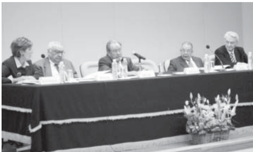
En la mesa Estructura y Gobierno Universitario.