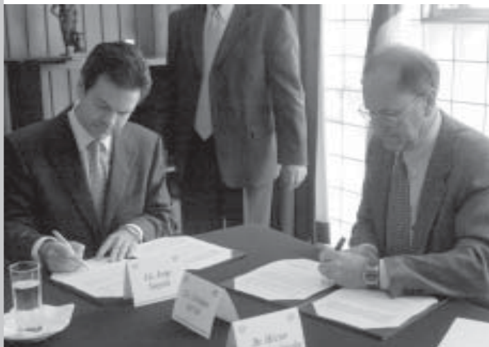
Durante la firma del acuerdo.

Impulsan tratamiento contra alto consumo de alcohol. La UNAM y Grupo Modelo firmaron un convenio de colaboración para hacer investigación sobre tratamientos oportunos contra consumo de alcohol.