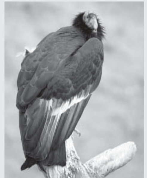
Cóndor de California, extinto en territorio mexicano.