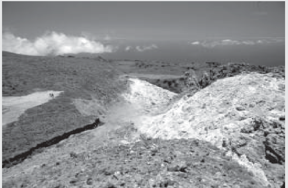
Isla Socorro, en el Archipiélago de Revillagigedo.

Reveló que en Europa hay un plan de manejo para conservar esta especie y el proyecto se realiza en colaboración con el Instituto Endémicos Insulares, con base en San Francisco, California. Sin embargo, como existen animales más carismáticos