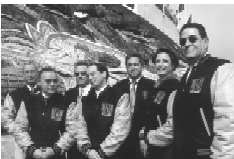
Integrantes del Consejo Consultivo.

A sí como la Universidad ha logrado repuntar su liderazgo de manera extraordinaria en diversos ámbitos como el académico, la investigación y la cul-