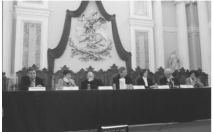
Durante la presentación de la agencia en el Palacio de Minería.

Estudiantes de los últimos semestres de Periodismo, en la licenciatura de Ciencias de la Comunicación, pueden realizar sus prácticas profesionales en un ambiente similar al del mercado laboral; la agencia aspira a convertirse en fuente de información académica universitaria