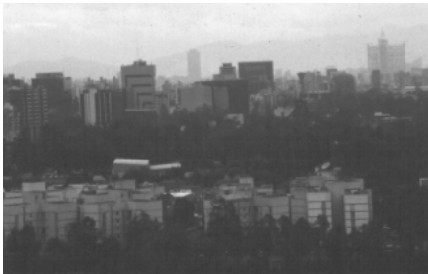
La urbanización apresurada es una consecuencia de la globalización.

Por otro lado, añadió, la sola capacitación o entrenamiento laboral, o el ser competente, tam-