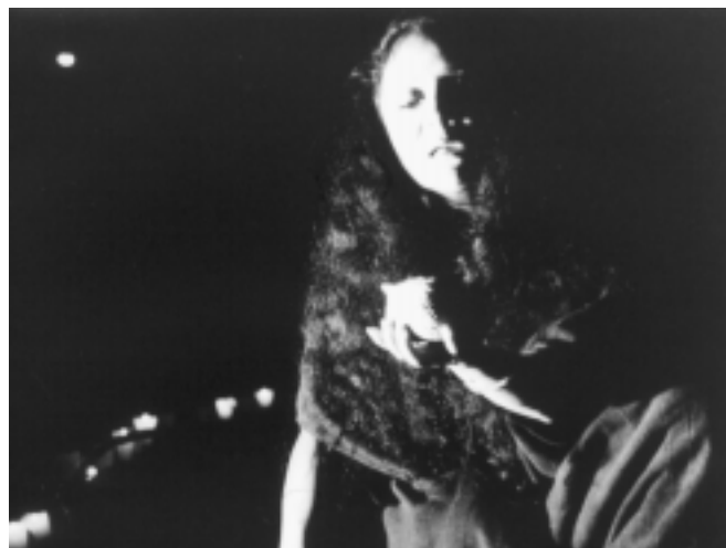
Los hombres compiten por las mujeres.

que pensarse no sólo en salvarlos a ellos, sino también a las víctimas.