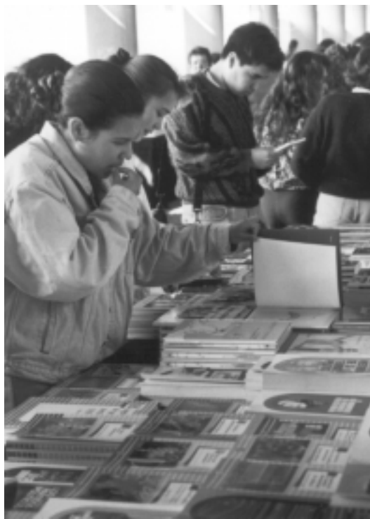
Los derechos culturales tutelan intereses relevantes de núcleos diversos de la sociedad.

El jurista mencionó que se reconocen cuatro