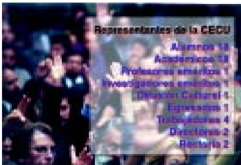
Sesión del Consejo Universitario.