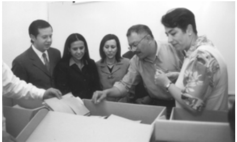
El archivo será sometido a un tratamiento profesional de restauración, catalogación y resguardo.

Cabe mencionar que el extinto Fernando López Arias (1905-1978) fue senador del Congreso de la Unión por el estado de Veracruz en 1946. De 1952 a 1953 ocupó el cargo de oficial mayor del Departamento del Distrito Federal. De 1958 a 1962 fue procurador general de la República y de 1962 a 1968 gobernador constitucional de Veracruz, entre otros cargos. ■