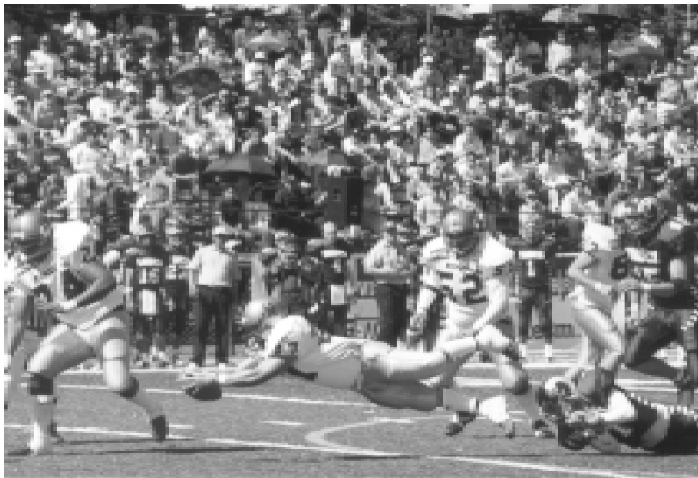
La defensiva puma paró a los Borregos.