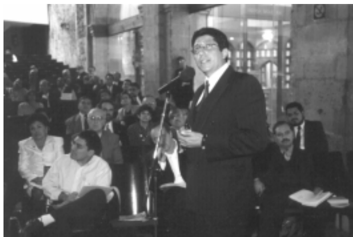
Durante el informe del Grupo de Trabajo.

Todos los miembros de la CECU deberán ser miembros de la comunidad universitaria en calidad de profesor, investigador, técnico