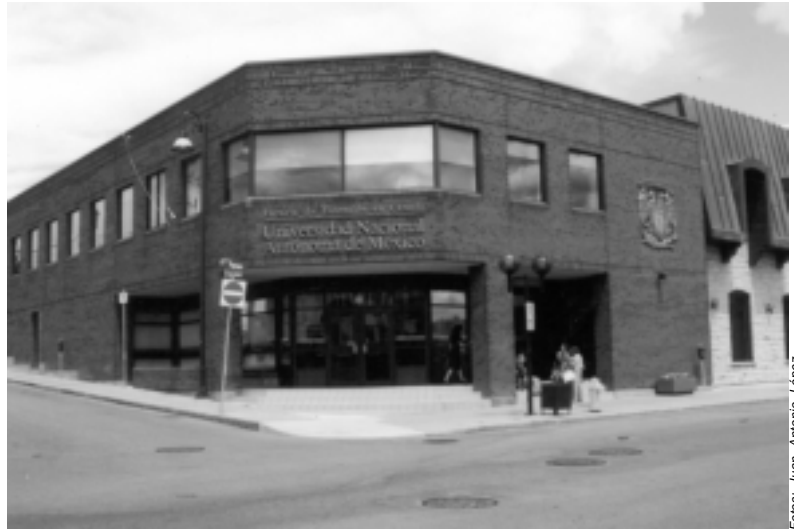
En Hull, Canadá.

Ante el fenómeno de la globalización del español –durante los próximos 10 años habrá en el mundo más de 400 millones de hispanohablantes–, el CEPE va a la vanguardia en América, ya que a partir de este año la UNAM es la única entidad en el país certificadora del dominio del español; el instru-