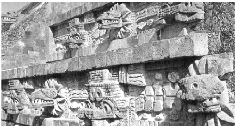
La pirámide de Quetzalcóatl, en Teotihuacan.

Dentro de los hallazgos ligados al calendario destacan la determinación precisa del año trópi