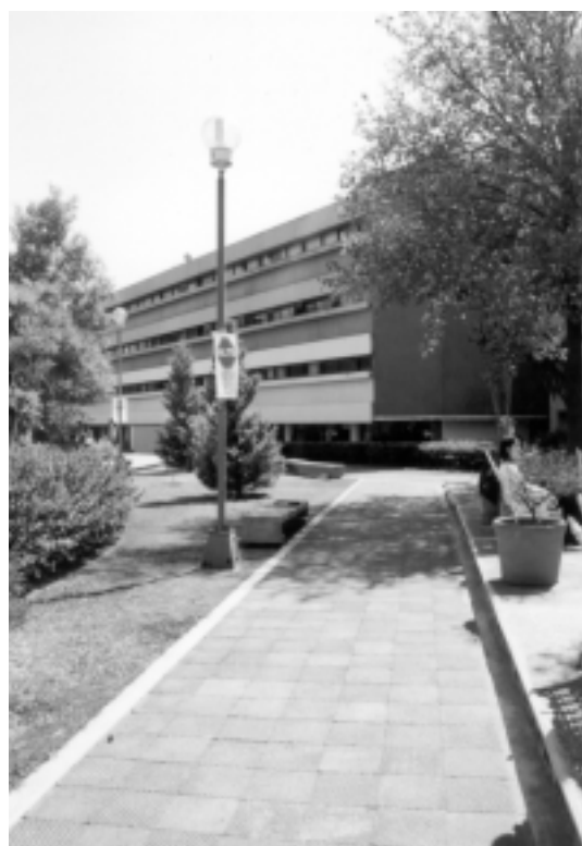
CEPE en Ciudad Universitaria.

Hoy día, frente a la migración de mexicanos hacia el país del norte, la Universidad Nacional, en colaboración con la Secretaría de Relaciones Exteriores, impulsa un proyecto para apoyar a las comunidades mexicanas en Estados Unidos, que incluirá diversas acciones tanto a distancia como presenciales. ■