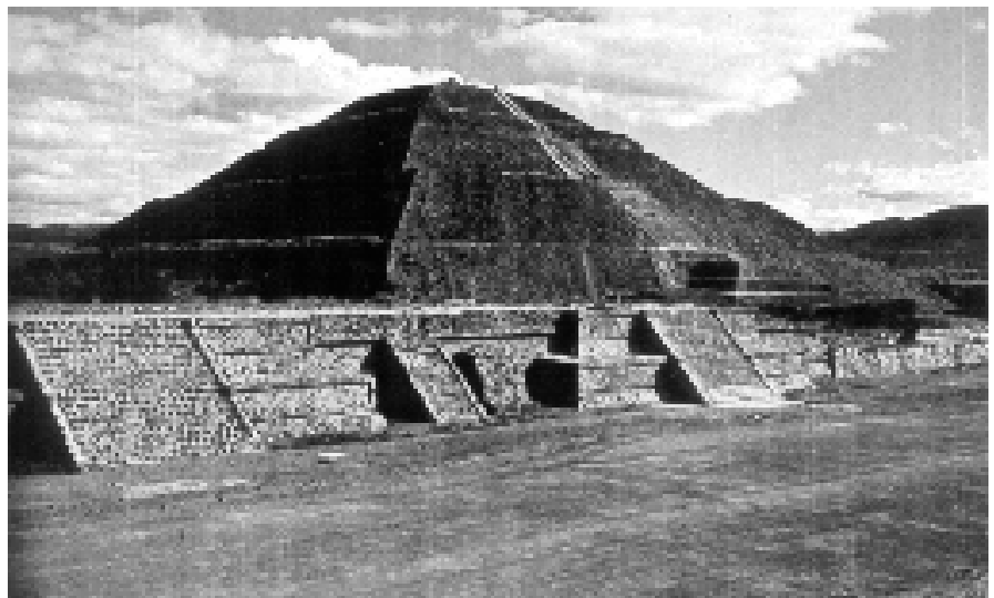
La pirámide del Sol y la Avenida de los Muertos, en Teotihuacan.

Durante la evolución de esta sociedad los