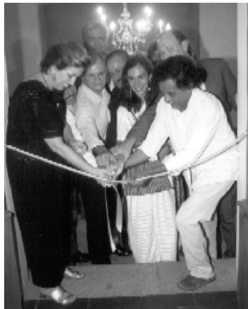
Ceremonia de apertura.

Enfatizó que en este contexto destaca la labor del instituto, que desde hace tiempo ha incrementado su colaboración con instituciones estatales, mediante la