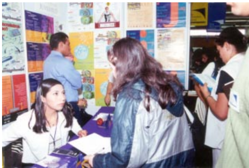
De los 14 mil 500 solicitantes, 38 por ciento ya tiene empleo y sólo asistirán en busca de otras posibilidades.