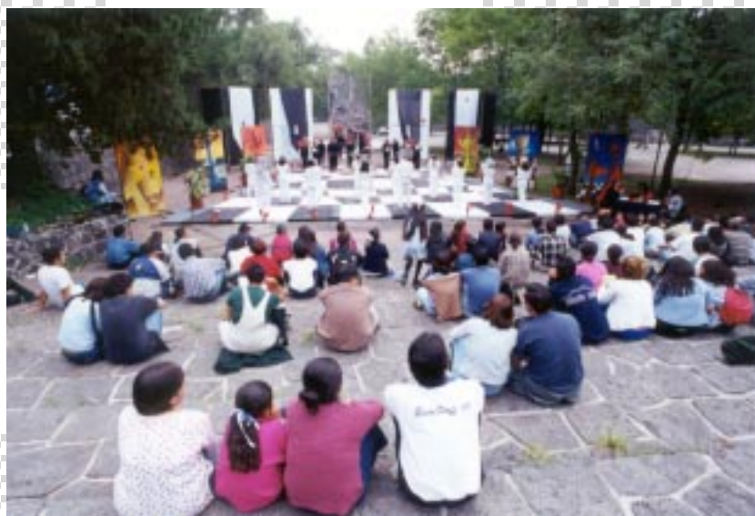
La partida fue representada en el Frontón Cerrado de Ciudad Universitaria.

cultades de Derecho, de Contaduría y Administración, de Filosofía y Letras, de la ENEP Aragón, de la escuela de Artes Plásticas, del Taller de Teatro de la ENEP Aragón y de escuelas particulares.