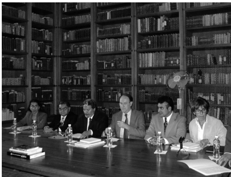
Ceremonia de donación.