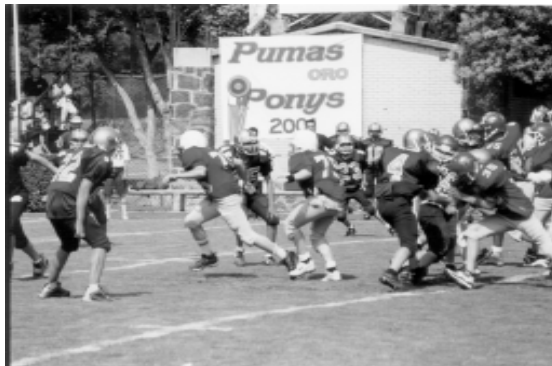
Pumas Oro contra Ponys.

de Fútbol Americano de la UNAM, comentó que este año la institución cuenta con una importante representación en las escuadras que están en competencia en la categoría infantil.