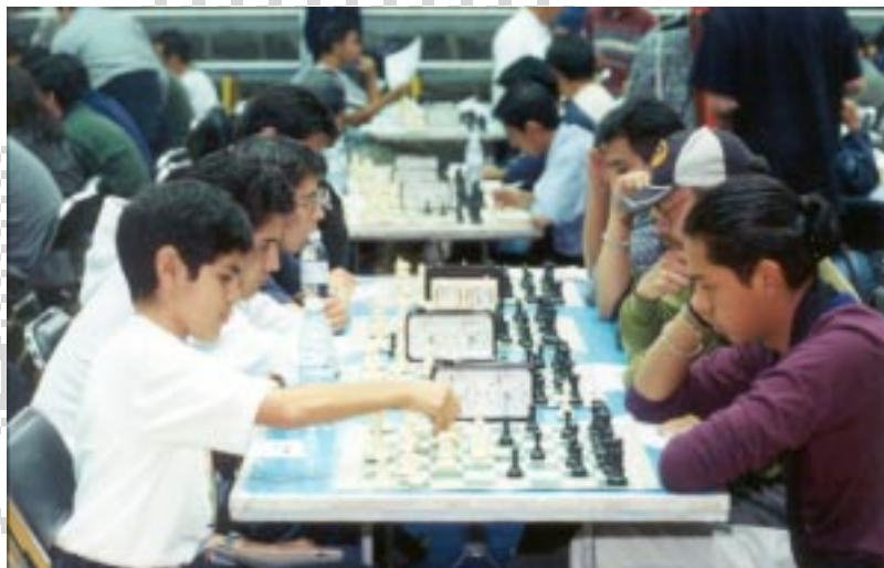
En el torneo se inscribieron 240 participantes.