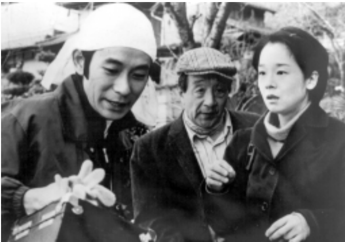
El iris en la mano, de Yoji Yamada, 1996.