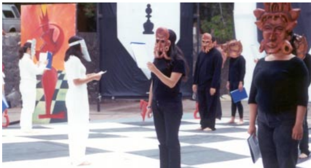
El medievo en el Frontón Cerrado.