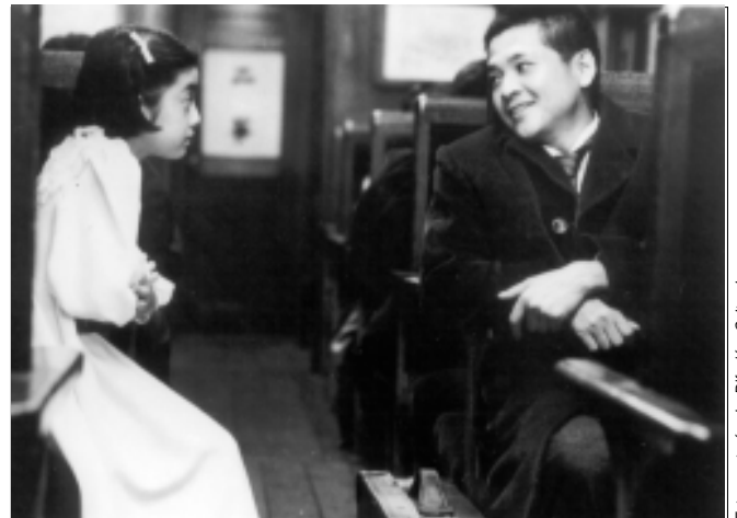
Tren nocturno a las estrellas, de Kazuki Omori, 1996.