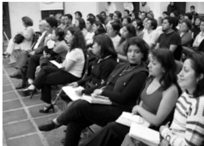
Asistentes a la presentación.