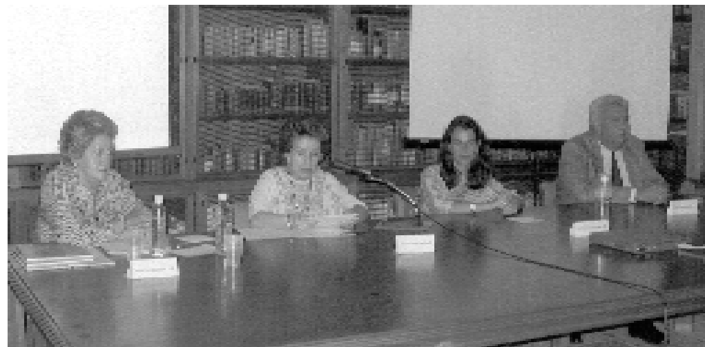
Durante la inauguración del ciclo de conferencias.

Las actividades de la sede foránea tendrán importantes frutos en estudios de la riqueza artística de Oaxaca