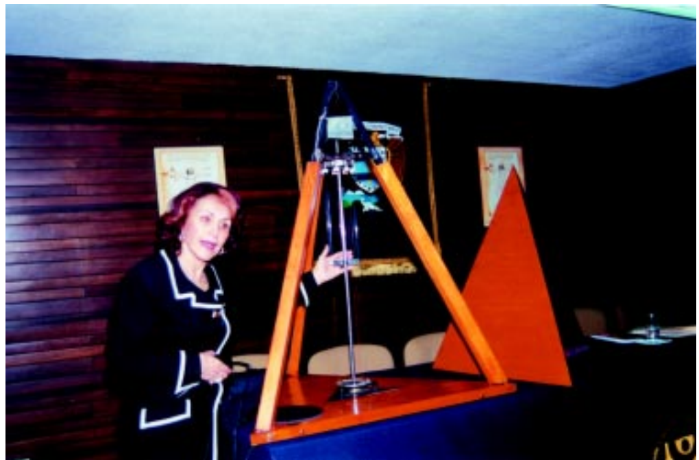
El sonoter mide 1.33 metros de altura.

● Escultura cinético-sonora de nueve cuerdas cuyo sonido causa que el ritmo cardíaco descienda hasta llegar a las ondas Alfa y conduce a un estado auto-hipnótico ○ En su creación confluyen escultura, música, pintura y mecánica eléctrica ○ Protocolo de investigación aplicado durante un año en el Centro Médico Siglo XXI