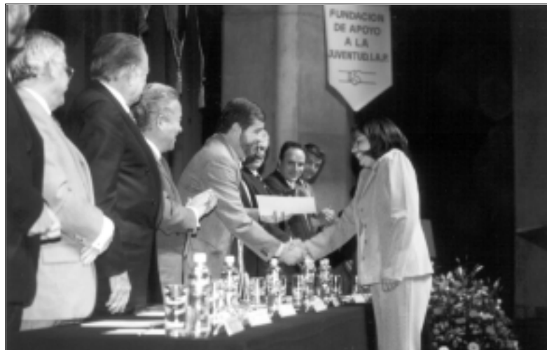
Emotividad durante la entrega de las preseas.