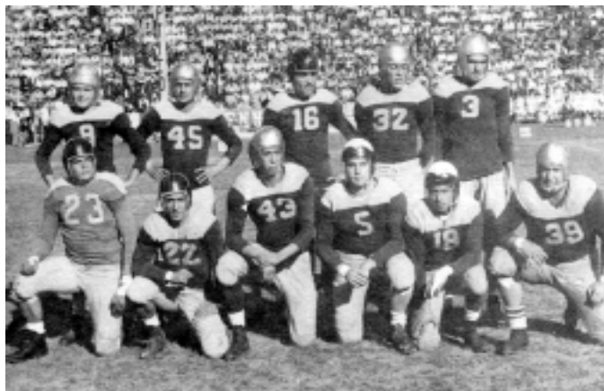
El fullback puma (No. 32) en el equipo de 1946.

Por tercera ocasión consecutiva el coach Francisco Chino Muñoz, estratega de Leopards de Prepa 8 de la UNAM, se llevó la designación del coach del año. ■