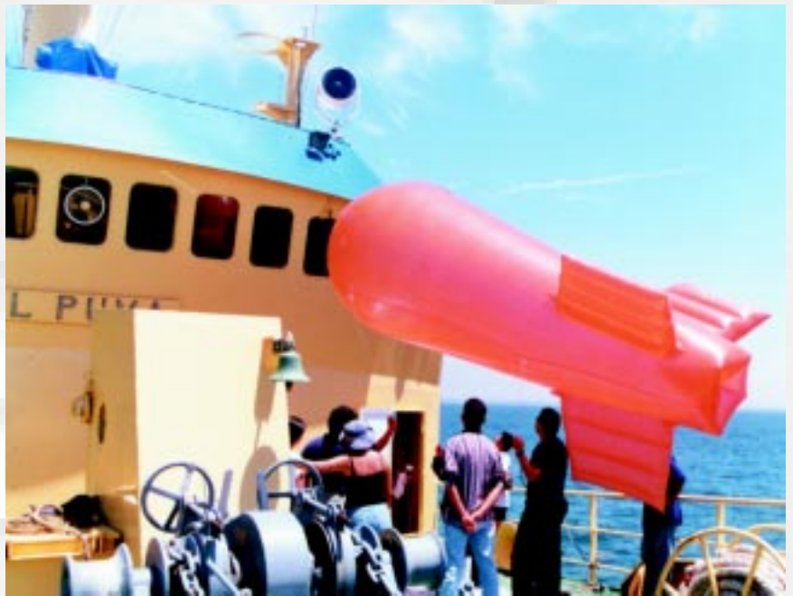
Globo cautivo para muestreo meteorológico.

al anochecer. La zona de trabajo se determina según sea la disciplina; por ejemplo, para muestreos geológicos se establece un área donde se encuentren sedimentos.