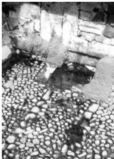
Vestigios de su pasado remoto.

Hoy, el Palacio de la Escuela de Medicina cumple 181 años de haber enterrado el último resquicio de la Inquisición, aunque sus paredes guardan aún pasajes increíbles y por sus patios deambulan las sombras de La mulata de Córdoba y de muchos otros personajes históricos que pasaron por ahí. ■