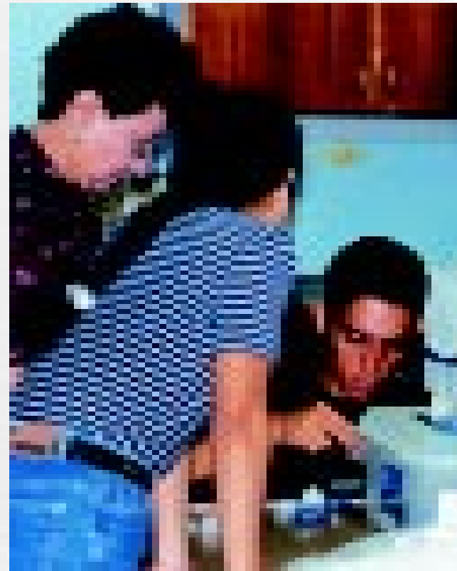
Procesado de muestras de agua.

“No puede abandonarse el trabajo en él. Más aún, estamos obligados a demostrar que México tiene capacidad para navegar en su zona económica exclusiva y estudiar y explotar los recursos naturales que en ella existen. En este sentido, en el curso de Métodos de Investigación Oceanográfica