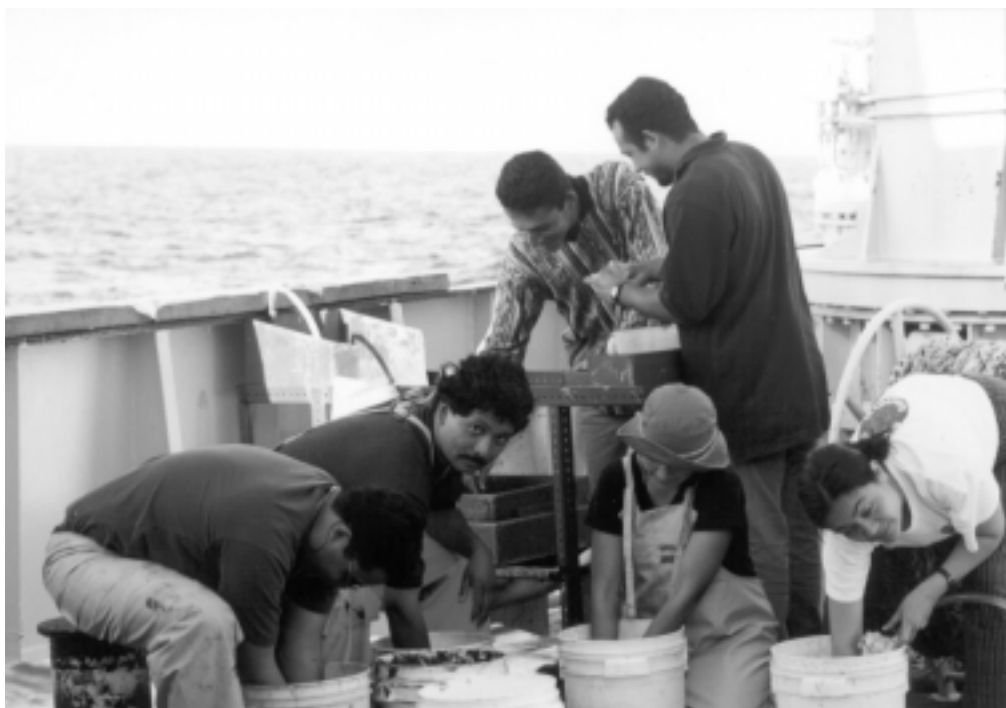
Lavado y filtrado de muestras de bentos.

Agregó que los barcos oceanográficos son utilizados, en general, para efectuar y desarrollar proyectos de investigación específicos, y sólo el realizado como parte de este curso de posgrado es de índole didáctica.