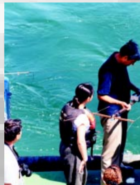
Lanzamiento de cuerpo de deriva para medición de c...