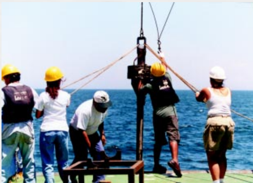
Nucleador de gravedad para sedimentos.

Una de las ventajas de la práctica es que en ella confluyen químicos, físicos, geólogos y biólogos. Es de las pocas materias en donde se integran todos los grupos para un mismo fin: planear y ejecutar una campaña de investigación oceanográfica, lo cual fortalece el trabajo multidisciplinario, necesario e importante en el estudio de las ciencias del mar.