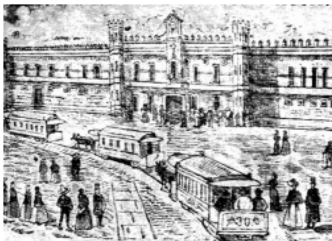
El traslado de los presos de Belem.