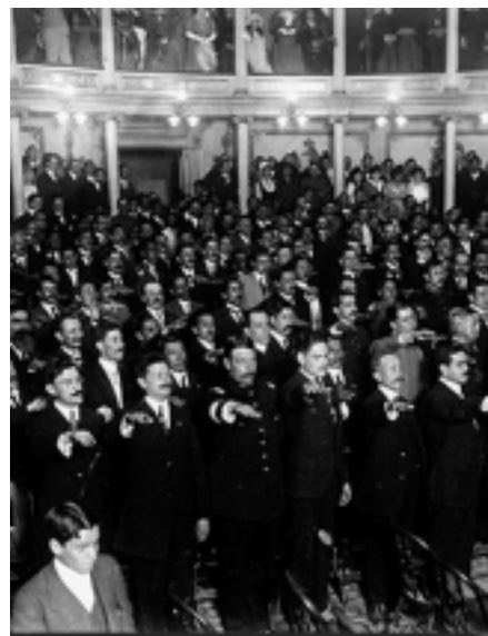
El Congreso Constituyente de 1916-1917.

En 1862, debido a las malas condiciones de la cárcel La Cordada, a que la ciudad había crecido hacia el poniente, y la prisión quedaba cerca de la Alameda y del más importante de sus paseos, el de Bucareli, el gobierno destinó