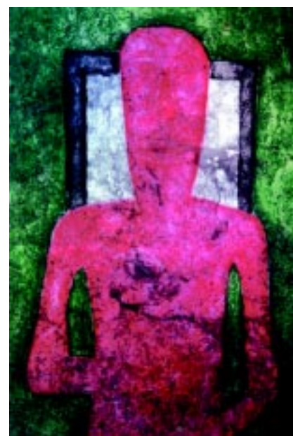
Hombre en rojo .