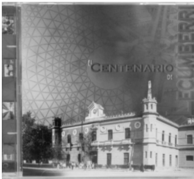
La portada del CD-Rom.

En la presentación, efectuada en el auditorio de