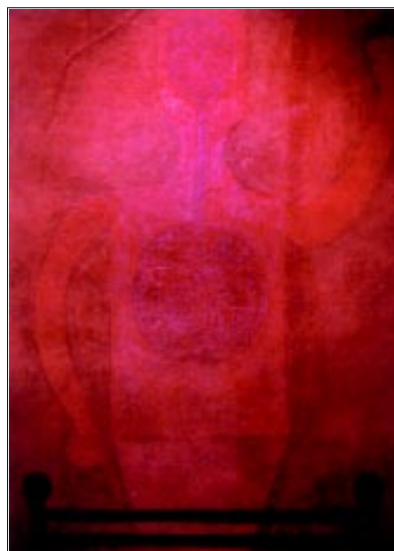
Hombre en rojo con cama .