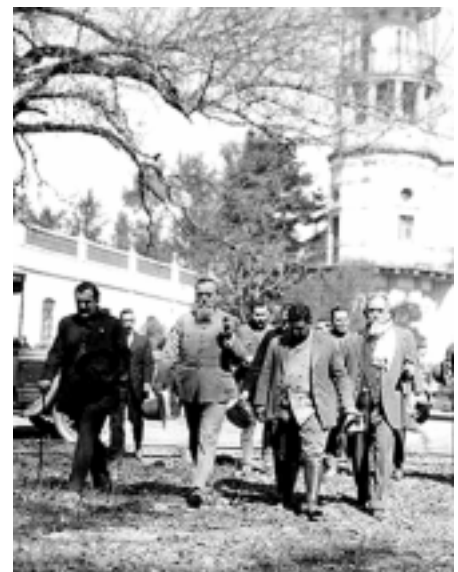
Huerta devaluó el peso; atrás, Lecumberri.

el extinto Colegio de Belem para prisión.