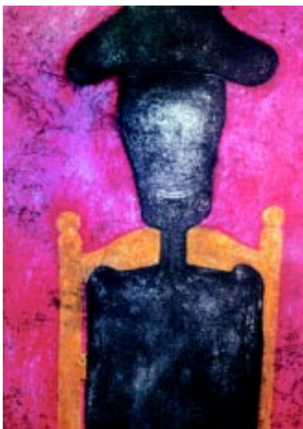
Torso en negro .

De 1970 a 1979 tuvo una abundante creación pictórica que se compara a su producción gráfica, mientras que de 1980 a 1989 se observa en su obra el rigor plástico y la imaginación que transfigura el objeto de los polos que definen su pintura en este decenio. La síntesis a la que llegó el artista incluye el arte precolombino y las vanguardias del siglo. Murió el 24 de junio de 1991; su último cuadro fue El muchacho del violín . ■