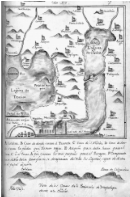
El proyecto de desagüe de la Laguna de Texcoco.