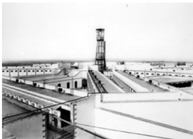
El proyecto arquitectónico.