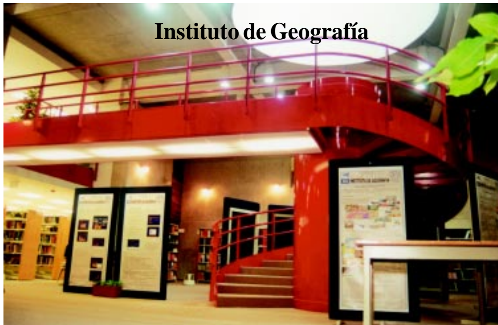
Instituto de Geografía

• La originalidad de pensamiento, rasgo esencial del personal académico de la facultad universitaria □ 5