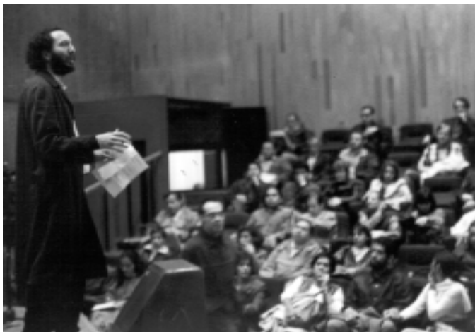
El director y guionista de Rito terminal presenta el disco compacto.

aseveró al final que no puede ser más satisfactorio el arranque del programa y alentador lo hasta ahora obtenido con la ópera prima de Urrutia. Resta, agregó, enfrentar el reto de consolidarlo para que pueda ser autofinanciable y garantizar su continuidad.