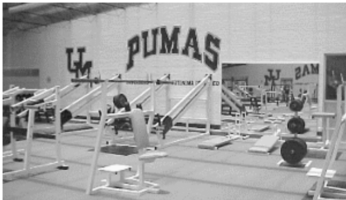
El gimnasio de Pumas-CU, funcionales instalaciones en el corazón de Ciudad Universitaria.

Por su parte, Carlos Rosado les recordó a los presentes que desde su llegada –hace poco más de un año a la subdirección de futbol americano– les prometió dotar al