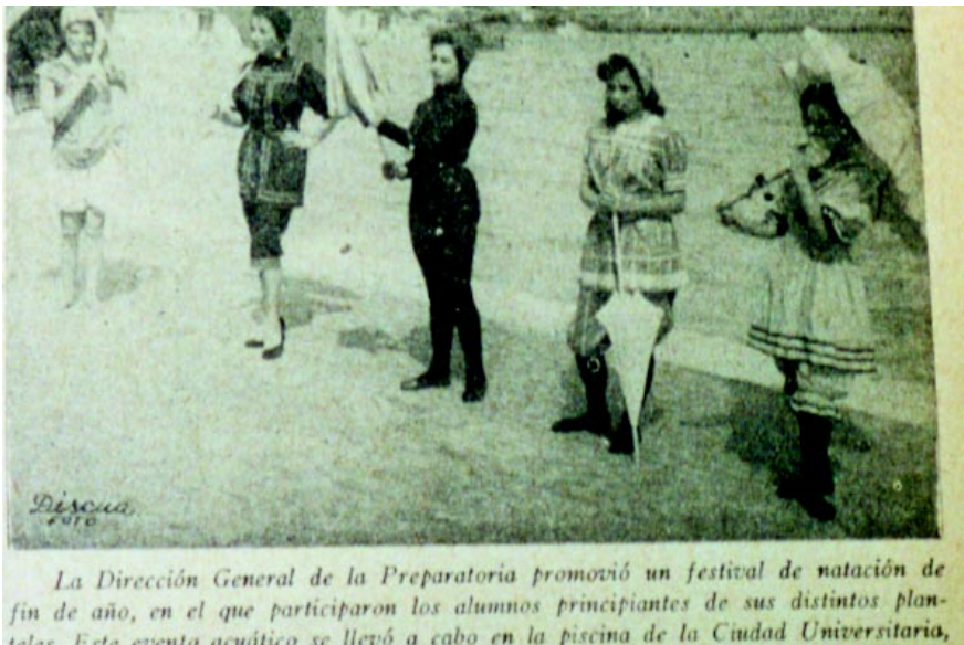
Lunes 1 de noviembre de 1954. Festival acuático y desfile de trajes de baño (moda 1900), organizado por la Prepa.