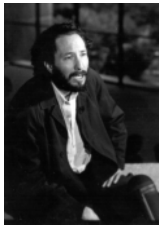
El cineasta Óscar Urrutia Lazo.

por su calidad artística y técnica (el premio de la crítica de la XV Muestra de Cine Mexicano de Guadalajara, las nominaciones en 14 especialidades para los Arieles de la Academia Mexicana de Artes y