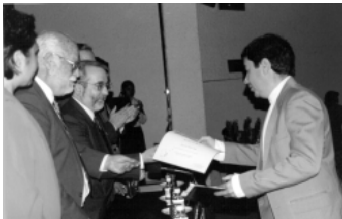
Durante la entrega de medallas y diplomas.

Exhortó a los docentes a incluirse en el sistema de tutores de licenciatura, para contribuir a incrementar el índice de titulación y los conminó a continuar con sus estudios de posgrado y lograr la definitividad de sus asignaturas. ■