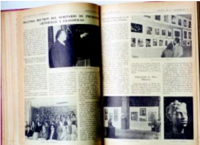
Lunes 4 de abril de 1955. Reunión del Seminario de Problemas Científicos y Filosóficos.