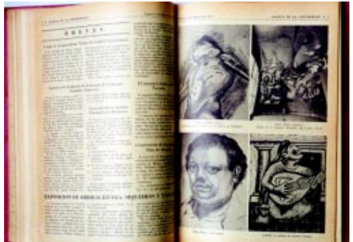
Lunes 21 de febrero de 1955. Exposición de Orozco, Rivera, Siqueiros y Tamayo, en la Biblioteca Central de Ciudad Universitaria.