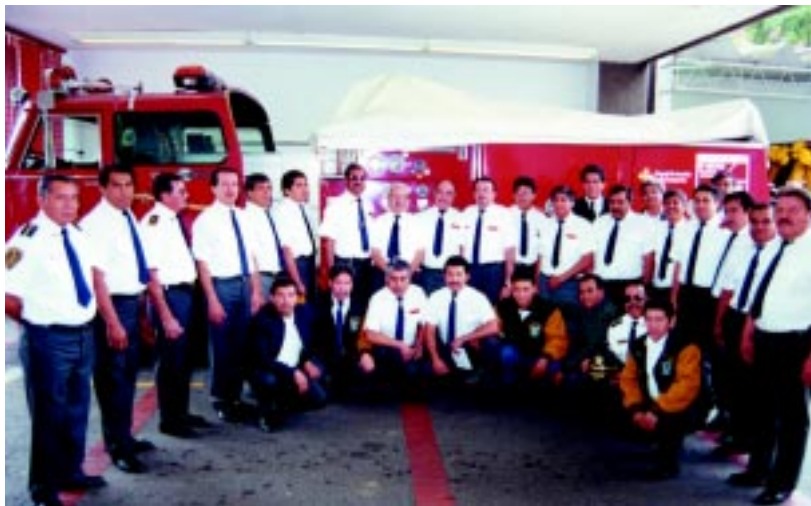
Los apaga fuegos universitarios celebraron el Día del Bombero.