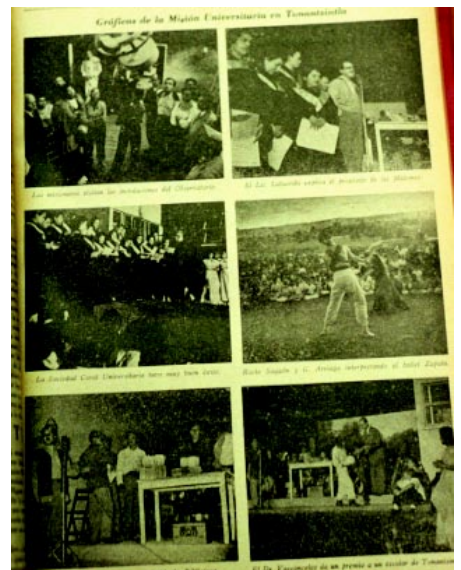
Lunes 6 de diciembre de 1955. Gráficas de una misión universitaria a Tonalantla.