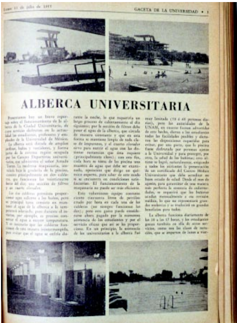
Lunes 11 de julio de 1955. Reportaje del funcionamiento de la Alberca Olímpica.